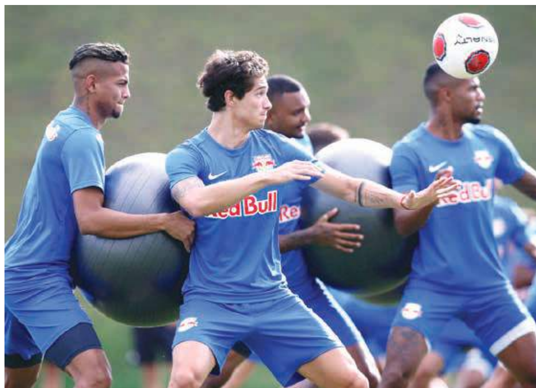
Jogadores do Massa Bruta tiveram uma semana intensa de treinos em dois períodos, já visando a estreia no Paulistão

Voltando a falar da pré-temporada, os jogadores seguem treinando forte em dois períodos no CT HWT. Além de estarem ansiosos para o início da temporada de competições, os atletas também estão com muita energia e se dedicando muito aos trabalhos, pois, além