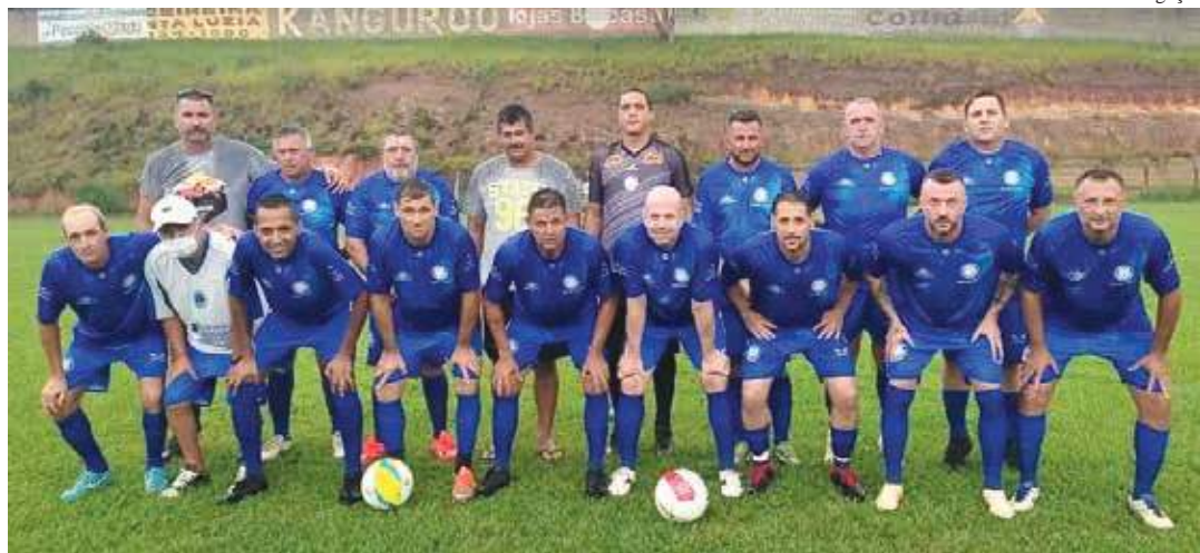
Time do Cruzeiro empatou na primeira rodada do campeonato e hoje a tarde enfrenta o Unidos

A Liga Bragantina de Futebol (LBF), em parceria com a Prefeitura Municipal, por meio da Secretaria Municipal da Juventude, Esportes e Lazer (Semjel), agendou, para a tarde deste sábado, 22, a realização da segunda rodada do Campeonato de Veteranos 45 anos, que homenageia o saudoso radialista e esportista Renato Caffé, que faleceu em 2020, dando seu nome para o evento.