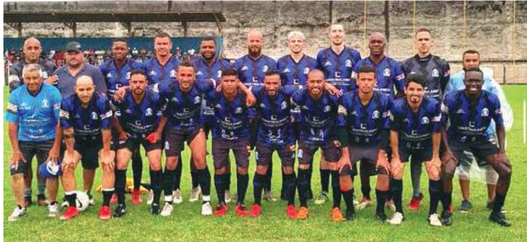
Para chegarem à grande final, Unidos e Santos eliminaram, nas cobranças de penalidades máximas, as equipes do Vila Edna e Santa Luzia, respectivamente

A Prefeitura Municipal, por meio da Secretaria Municipal da Juventude, Esportes e Lazer (Semjel), com o apoio da Liga Bragantina de Futebol (LBF), marcou, para o período da manhã deste domingo, 23, a grande final da Copa Bragança de Futebol 2021/2022, en-