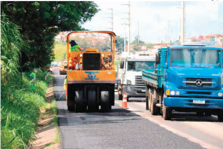
Os serviços de manutenção dos acostamentos da SP-008 na Rodovia Capitão Barduíno começaram nesta semana