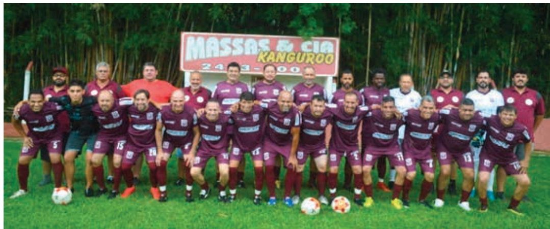
Time do Ferroviários tem a melhor campanha do campeonato, com apenas um empate e sete vitórias