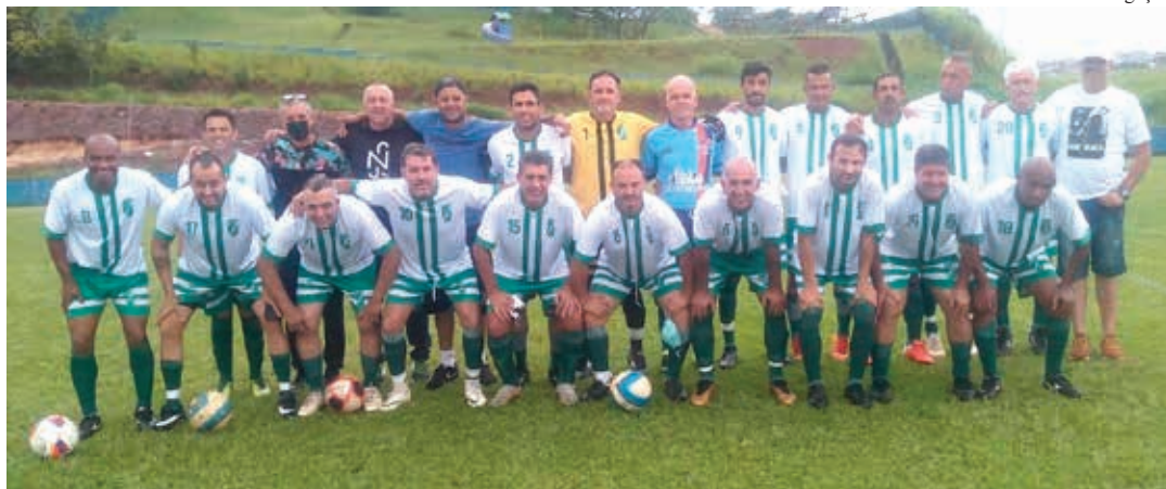
Equipe do Santa Luzia também está invicta na competição, com quatro vitórias e quatro empates