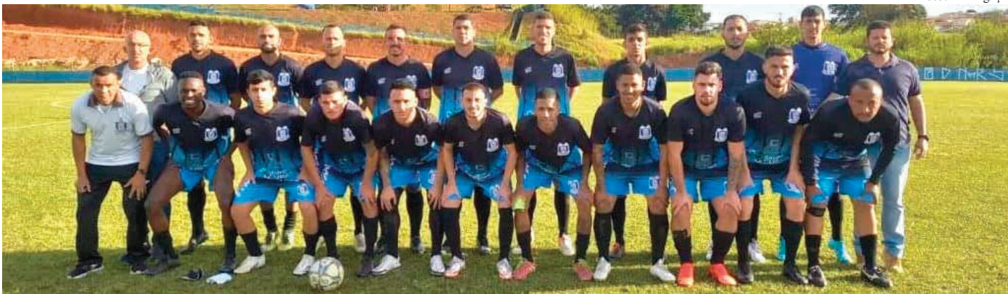
Time do Unidos já está classificado para as quartas de final e com 100% de aproveitamento

recida já conquistaram a classificação direta para as quartas de final. E agora, aguardam os duelos que serão disputados na tarde deste sábado, 4, para conhecer