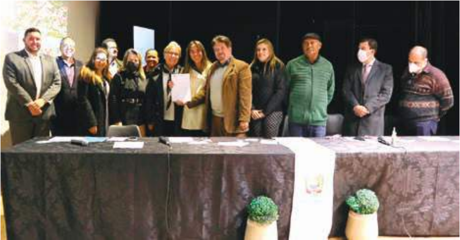
A RW Uniformes é especializada na fabricação de uniformes profissionais, universitários, escolares e promocionais. A empresa está sediada no município de Bragança Paulista