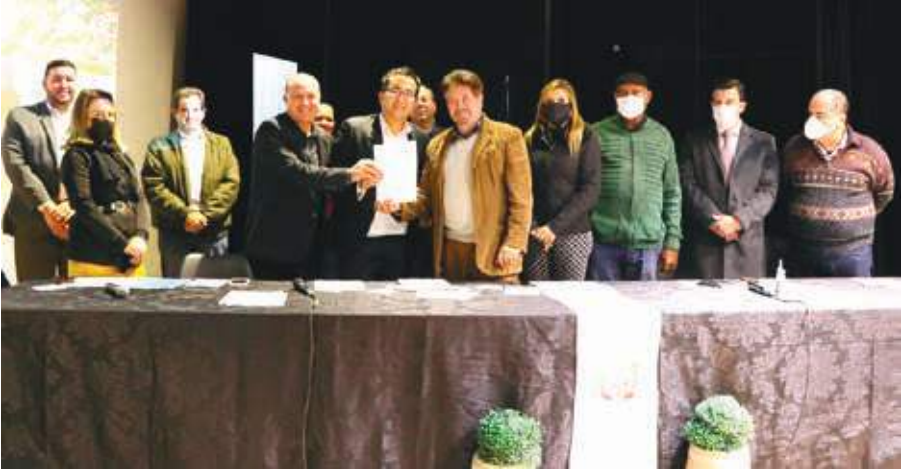
A Farmina Pet Foods Brasil é uma empresa multinacional de origem italiana do ramo de alimentação de cães e gatos. A firma transferirá sua filial de Atibaia para Bragança e abrirá mais 150 vagas de emprego