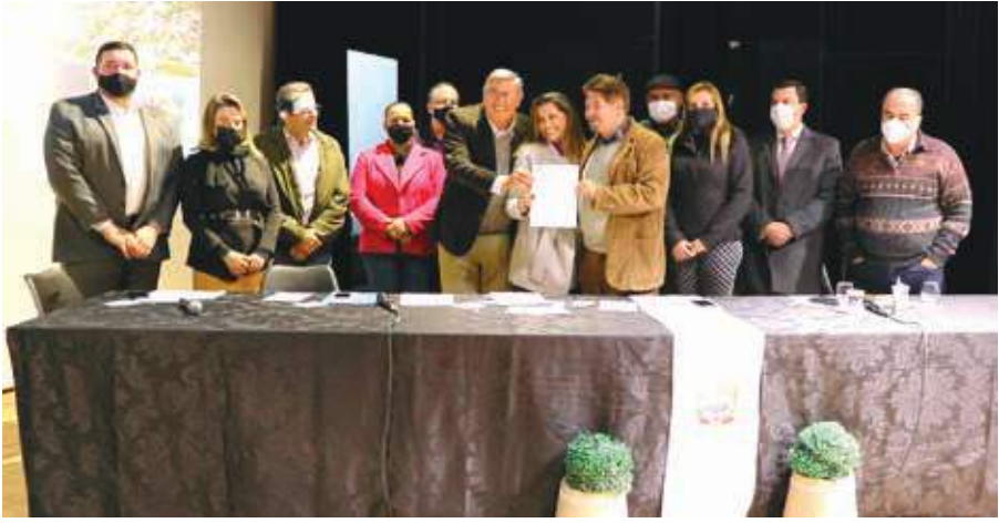
A empresa metalúrgica Work Eletro Sistemas, de Atibaia, transferirá sua sede para Bragança Paulista, onde abrirá mais 30 postos de trabalho à população