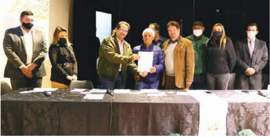
A Gráfica Bragança - Jornal em Dia atua há mais de 30 anos na cidade. Atualmente, a empresa está localizada na Rua João Franco, na Vila Bernadete e, com o Programa Pró-Emprego e Pró-Indústria, terá a possibilidade de ampliar seu parque gráfico e abrir novas vagas de emprego