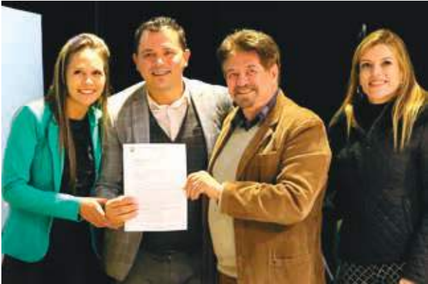
A Chardon Brasil Produtos e Serviços de Energia é uma multinacional fabricante de produtos poliméricos de média tensão para sistemas de serviços públicos em todo o mundo. A empresa transferirá sua sede do Rio de Janeiro para Bragança Paulista