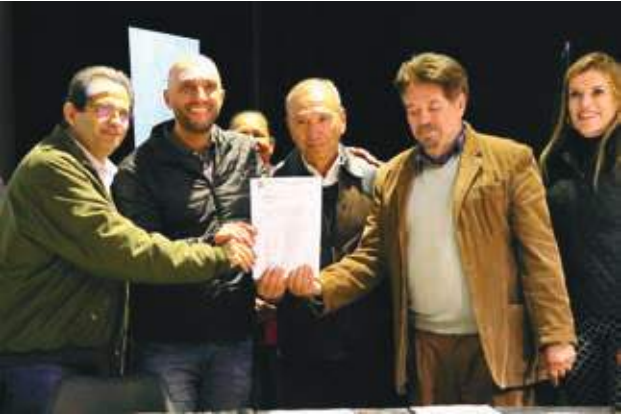
A Tetralite Fireproof atua há mais de cinco anos com soluções em isolamento térmico. Sua sede fica na cidade de Mairiporã e, com a doação do terreno, será transferida para Bragança Paulista, onde abrirá 45 novos postos de trabalho

Na última segunda-feira, 13, a Prefeitura de Bragança Paulista realizou uma cerimônia para a assinatura dos projetos de lei de doação de terrenos para seis empresas de Bragança e Região e uma do Rio de Janeiro. Os empreendimentos venceram a primeira fase do programa Pró-indústria e Pró-Emprego, que busca fomentar o desenvolvimento econômico do município. Entre os aprovados, destaca-se a Gráfica Bragança-Jornal em Dia , que foi contemplada pelo projeto.