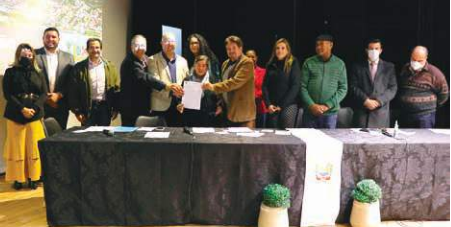
A JGG Chocolates Artesanais, que comercializa produtos da marca Puro Cioccolato, sendo a única empresa de chocolates artesanais da região, também ampliará suas atividades na cidade