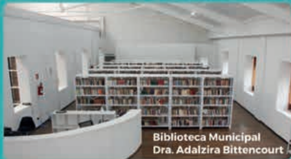
Biblioteca Municipal Dra. Adalzira Bittencourt