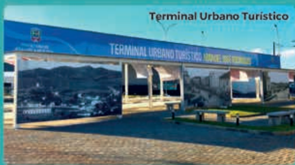
Terminal Urbano Turístico

Os investimentos em turismo e cultura só reforçam o que Bragança realmente é: um espetáculo.