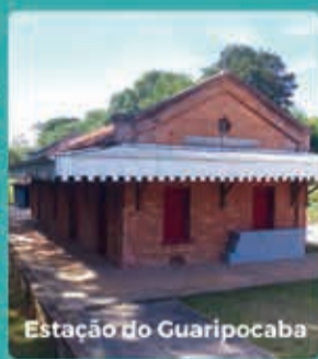
Estação do Guaripocaba