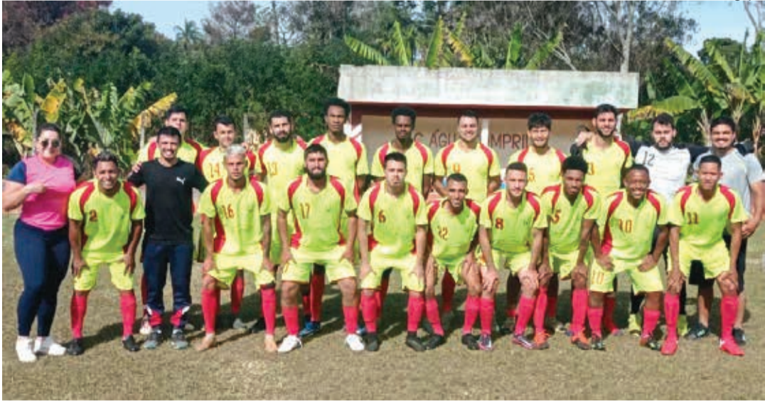
Time do São João do Campo Novo disputa o Campeonato Amador da Segunda Divisão de Bragança 2022