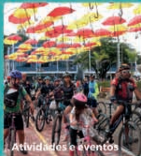
Atividades e eventos

Desde 2017, Bragança vem investindo, reconstruindo e ampliando os principais espaços turísticos e culturais da cidade. São investimentos destinados às áreas que mais conectam moradores e visitantes de todo o município. E vem muito mais por aí.