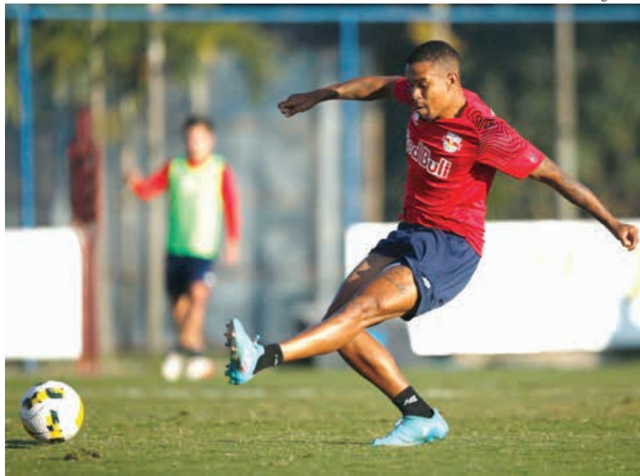
Por outro lado, o atacante Alessandro continua no departamento médico cuidando de lesão na posterior da coxa esquerda