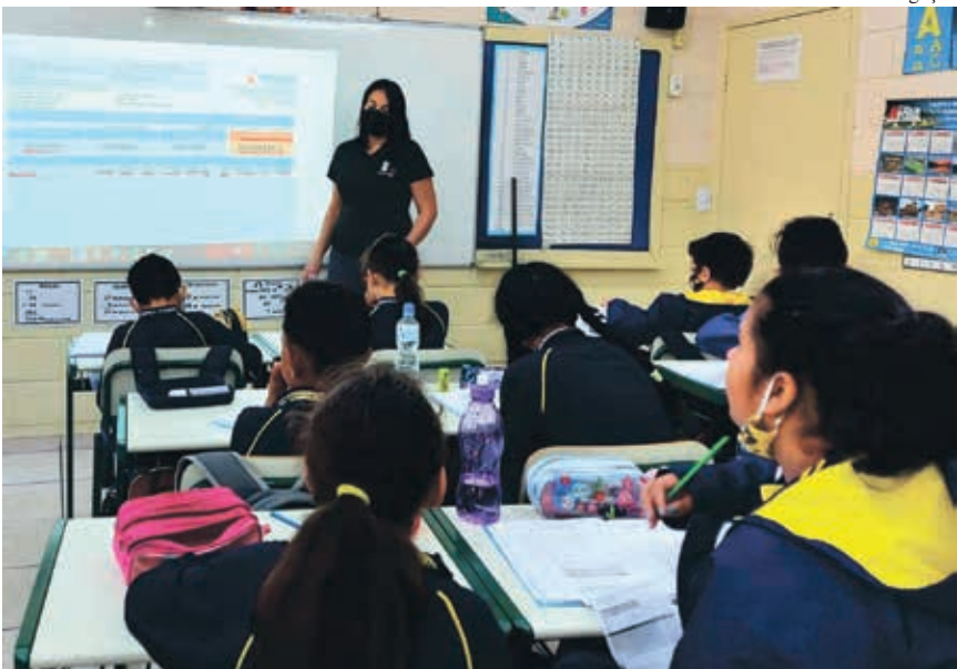
Análise da conta de energia da escola

sável pela manutenção da empresa. Já em fase final os alunos organizam uma maquete para compartilhar os conhecimentos obtidos com os colegas e familiares.