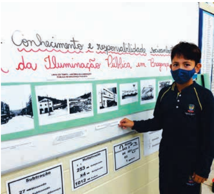
Linha do tempo, história da chegada da energia no município até os dias atuais