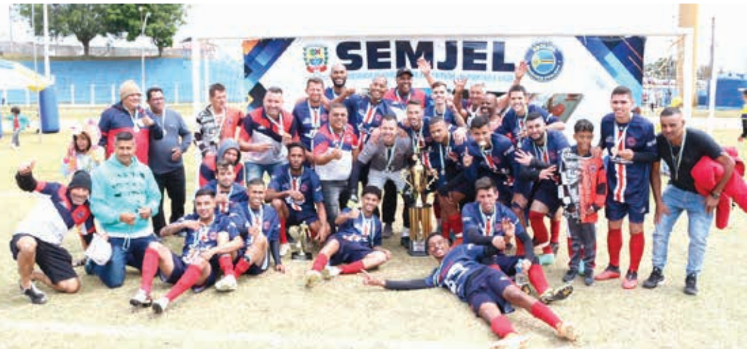
Time do União Vila Edna campeão

Com o acesso já garantido à elite do Futebol Amador de Bragança no ano que vem, União Vila Edna e Zeni entraram em campo, no último domingo, 4, para deci-