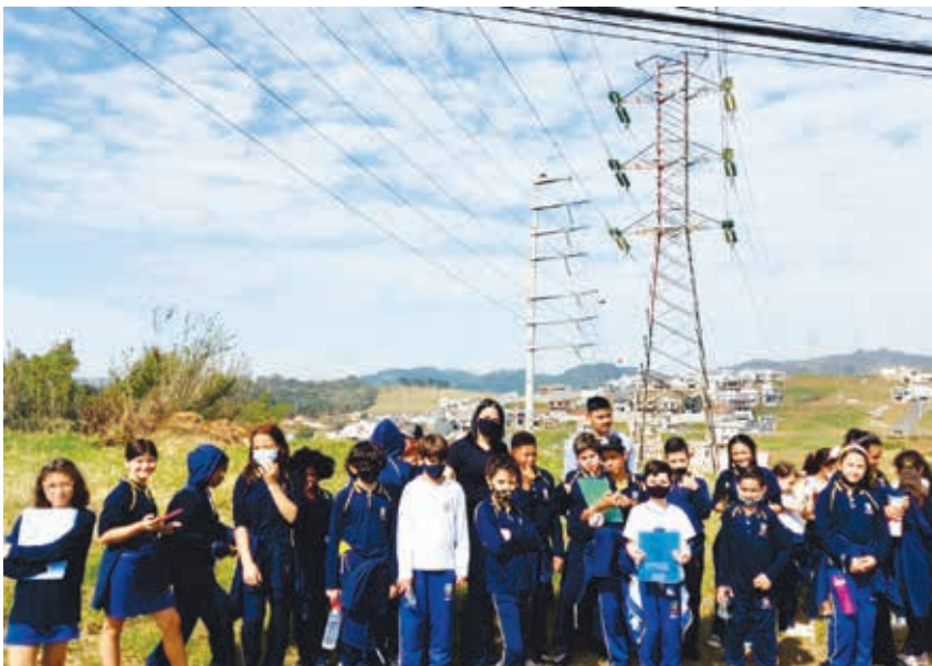
Visita ao entorno da subestação de energia no Recanto Elizabeth

Durante o desenvolvimento das atividades, entre as ações, os alunos participaram da construção da linha do tempo desde a chegada da energia elétrica no município até os dias atuais, analisaram as contas de luz da escola e de seus lares com o objetivo de atuarem como fiscais do desperdício de energia visando à economia e ao consumo consciente. Tiveram a oportunidade de realizar uma visita de campo ao entorno da subestação de energia localizada no Recanto Elizabeth e entrevistar o supervisor respon-