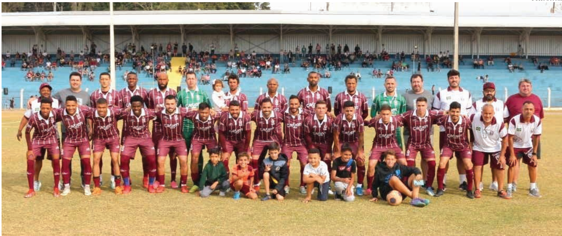
TIME DO FERROVIÁRIOS A. C., QUE CONQUISTOU O PENTACAMPEONATO AMADOR DA PRIMEIRA DIVISÃO DE BRAGANÇA, NESTE ANO

O adversário do FAC na decisão será a equipe do Realcedega F. C., represen-