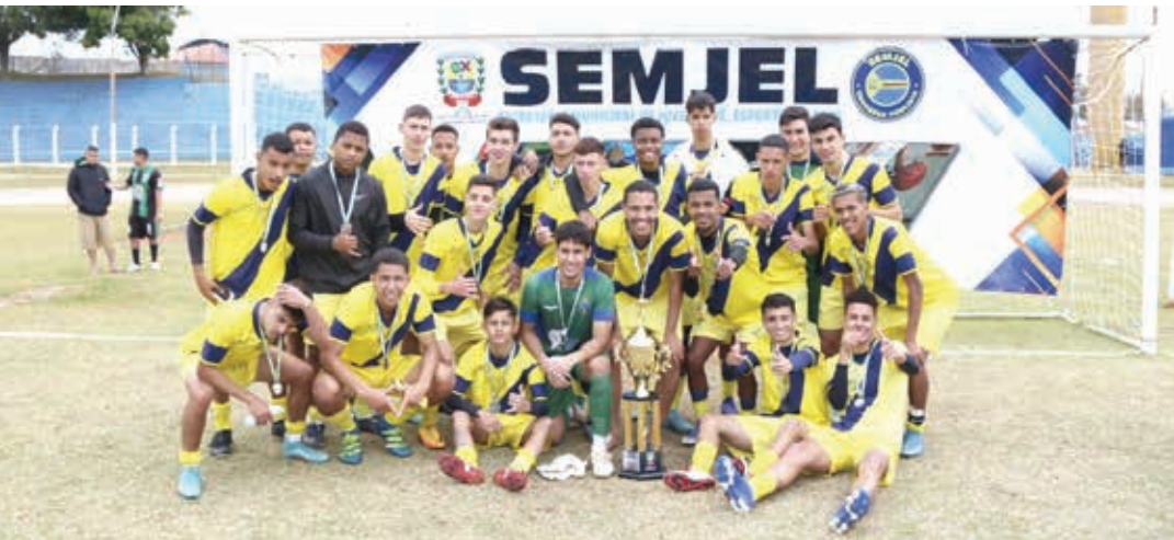
Equipe do Zeni vice-campeão