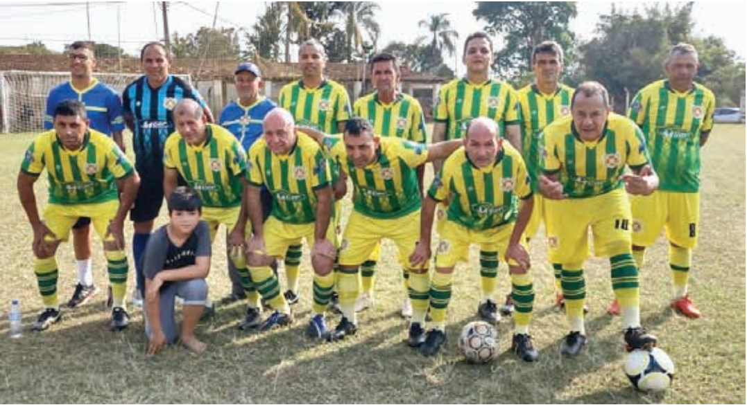
Time do Vila Garcia estreou com vitória no campeonato

A Liga Bragantina de Futebol (LBF) agendou, para a tarde de hoje, 17, quatro jogos pela segunda rodada do Campeonato de Veteranos 2022 – categoria 50 anos, que tem o apoio da