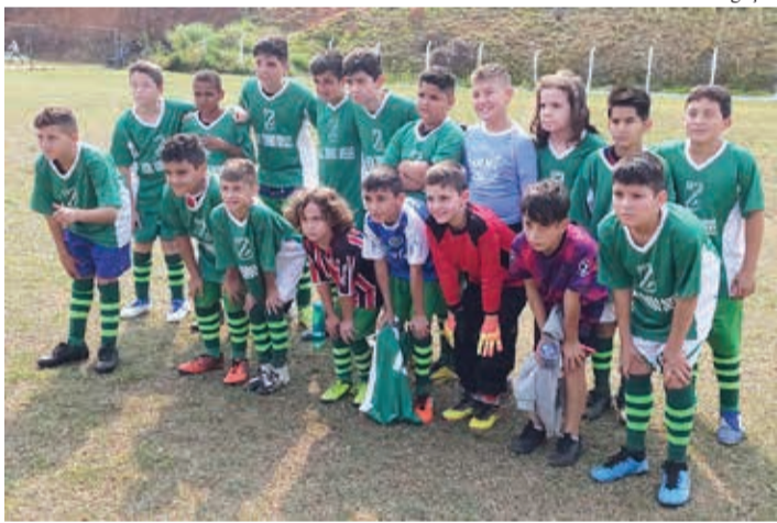
Categorias de base estreiam amanhã no Campeonato de Menores 2022