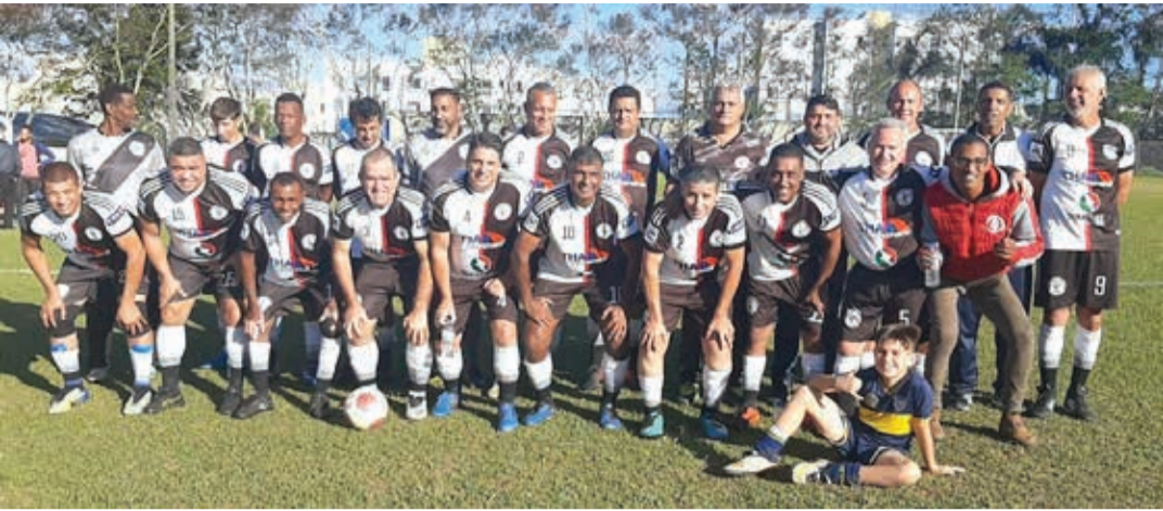
Time do E. C. Vila Aparecida que enfrenta o Santa Luzia neste sábado, 24, jogo que vale a liderança do Grupo B

Na tarde deste sábado, 24, acontece a terceira rodada do Campeonato de Veteranos 2022 – categoria 50 anos, organizado pela Liga Bragantina de Futebol (LBF), em parceria com a Prefeitura, por meio da Secretaria Municipal da Juventude, Esportes e Lazer (Semjel). As quatro partidas agendadas de hoje estão confirmadas para as 15h30. O destaque desta rodada será o duelo entre Santa Luzia e Vila Aparecida, que se enfrentam no Estádio Lincoln Rodrigues Siqueira, na zona sul da cidade. As duas equipes estão no Grupo B e quem vencer o confronto de logo mais assume a liderança isolada do