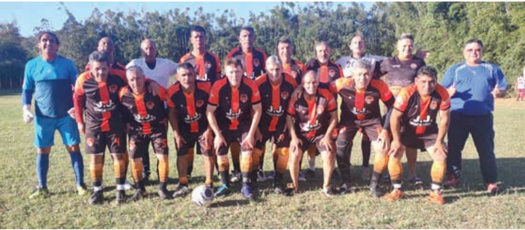
Equipe do Cedega enfrenta o Vila Garcia, querendo a reabilitação no campeonato

Na tarde deste sábado, 24, acontece a terceira rodada do Campeonato de Veteranos 2022 – categoria 50 anos, organizado pela Liga Bragantina de Futebol (LBF), em parceria com a Prefeitura, por meio da Secretaria Municipal da Juventude, Esportes e Lazer (Semjel). As quatro partidas agendadas de hoje estão confirmadas para as 15h30. O destaque desta rodada será o duelo entre Santa Luzia e Vila Aparecida, que se enfrentam no Estádio Lincoln Rodrigues Siqueira, na zona sul da cidade. As duas equipes estão no Grupo B e quem vencer o confronto de logo mais assume a liderança isolada do