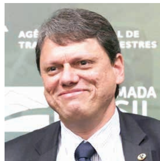
Tarcísio de Freitas

Os candidatos Luiz Inácio Lula da Silva e Jair Messias Bolsonaro disputam, no dia 30 de outubro, o 2º turno das eleições presidenciais de 2022. No 1º turno, Lula saiu vitorioso, obtendo 48,43% (57.259.504) dos votos válidos, enquanto Bolsonaro teve 43,20% (51.072.345). Como sempre, o ex-presidente teve um ótimo desempenho nos estados do Nordeste e foi o mais votado em Minas Gerais. Por outro lado, o atual presidente, Jair Bolsonaro, ganhou nos estados de São Paulo e Rio de Janeiro.