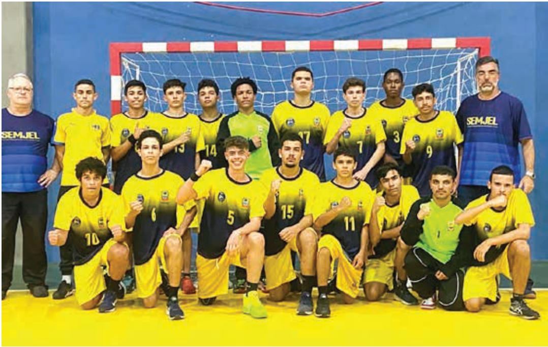
Equipe de Handebol Masculino

No Grupo A, estão: Piracicaba, Bragança Paulista, São José do Rio Pardo e Valinhos. No Grupo B, participam: São João da Boa Vista, Jundiaí e Rio Claro.