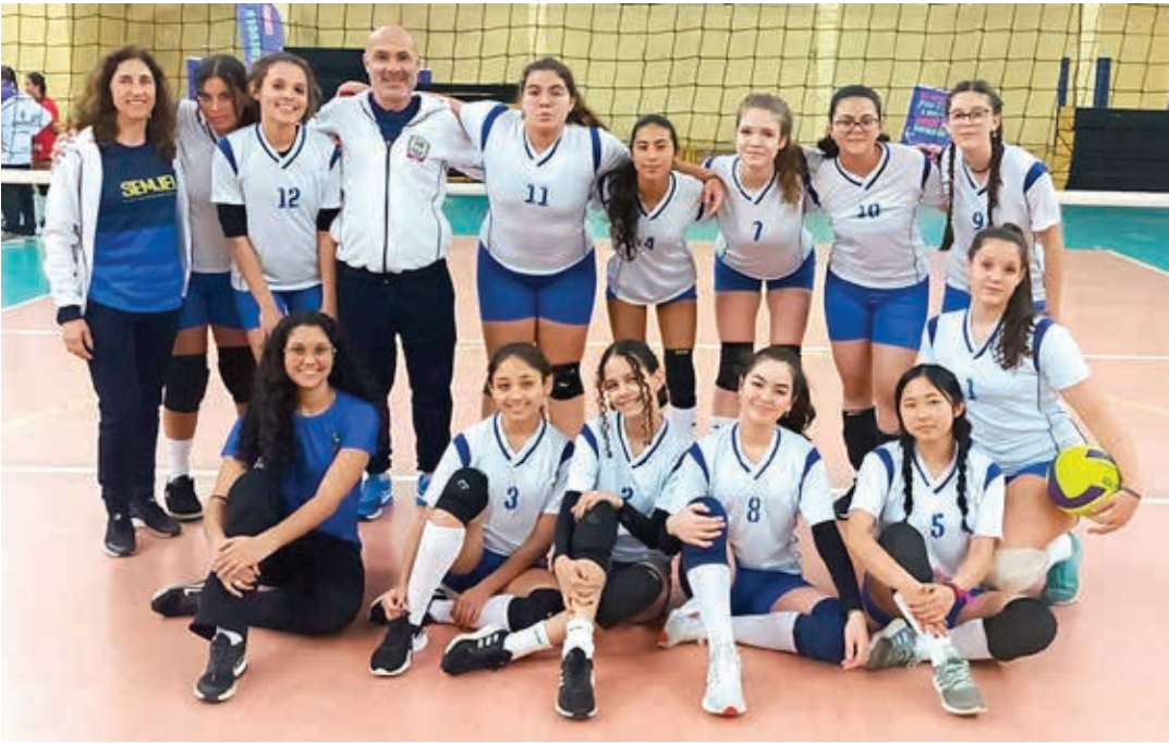
Equipe de Voleibol Feminino

A primeira fase é regional e as equipes da categoria infantil representarão o município