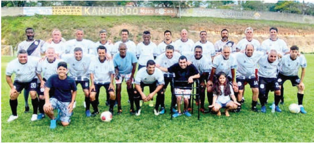
Time do Vila Aparecida chega para a decisão sem perder um jogo sequer

A Liga Bragantina de Futebol (LBF) marcou a final do Campeonato de Veteranos, categoria 50 anos – 2022, entre Vila Aparecida e Santa Luzia, para a tarde deste sábado, 29. Mais uma vez, o Estádio Municipal Cícero de Souza Marques foi escolhido para ser o palco da decisão, que está con-