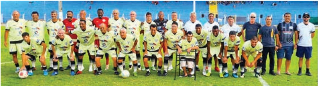
Time do Vila Aparecida conquistou o título de campeão invicto

Com o empate, a decisão foi para as cobranças de pênaltis e o Vila Aparecida foi mais eficiente, vencendo a disputa pelo placar de 5 a 3 e conquistando o título de campeão de forma invicta.