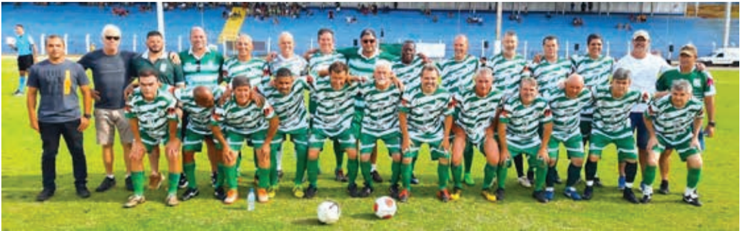
Equipe do Santa Luzia ficou com o troféu de vice-campeão