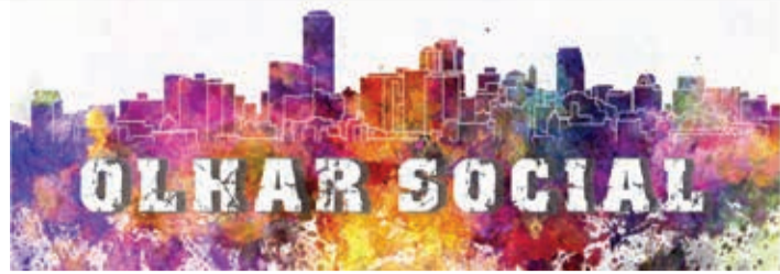
Imagem se fosse o contrário!

“Tivemos uma eleição dura, apertada, uma das mais apertadas, diferença pequena. Temos campos de pensamento que dividem o país. Uma linha mais progressista, uma mais liberal. O resultado das urnas é soberano. O que eu vou fazer em São Paulo, vamos honrar os compromissos. São Paulo tem muitas demandas, merece nossa atenção. A gente pretende traduzir o nosso plano, aquilo que defendemos na campanha”, disse o governador eleito.