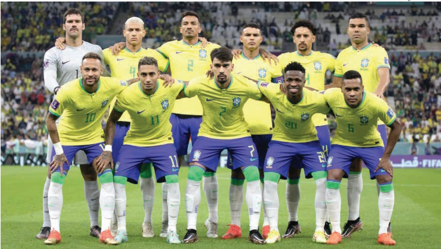
Em pé: Alisson; Richarlison, Danilo, Thiago Silva, Marquinhos e Casemiro. Agachados: Neymar, Raphinha, Lucas Paquetá, Vinicius Jr. e Alex Sandro

Com a bola rolando, o Brasil se impôs dentro de campo e desde o início da partida foi superior ao adversário, principalmente no segundo tempo, quando criou as melhores oportunidades. A seleção canarinha deu o primeiro passo rumo ao hexacampeonato e o futebol apresentado encheu o