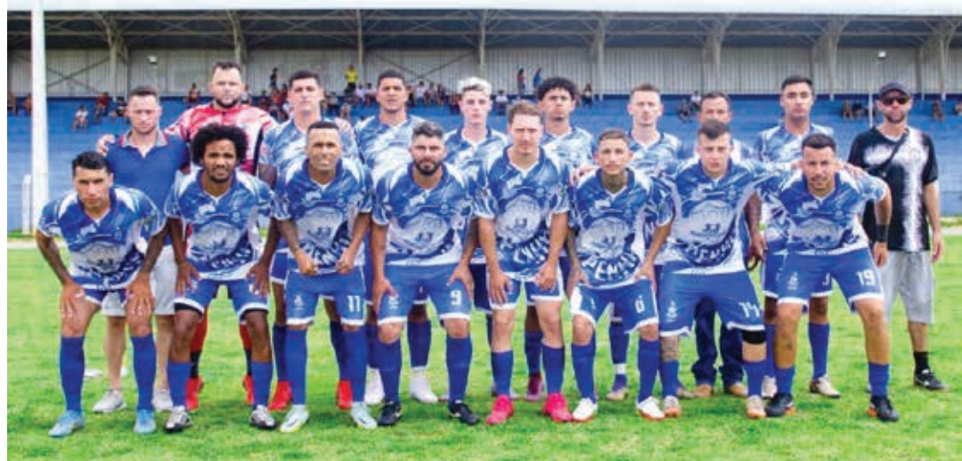
Time do Penha F. C.

A Liga Bragantina de Futebol (LBF) e a Secretaria Municipal da Juventude, Esportes e Lazer (Semjel), organizadoras dos campeonatos amadores realizados na cidade, definiram que a decisão do título do Campeonato Amador da Série C 2022, entre Penha F. C. e