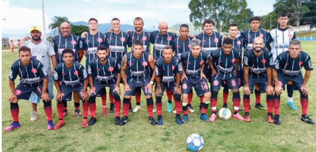
Equipe do Bandeirantes, da cidade de Vargem

Para chegar à final, o time do Penha eliminou a equipe do Extra do Menin, vencendo o duelo da semifinal pelo placar de 1 a 0. Já o Bandeirantes teve mais dificuldades para garantir a vaga na decisão. O representante da