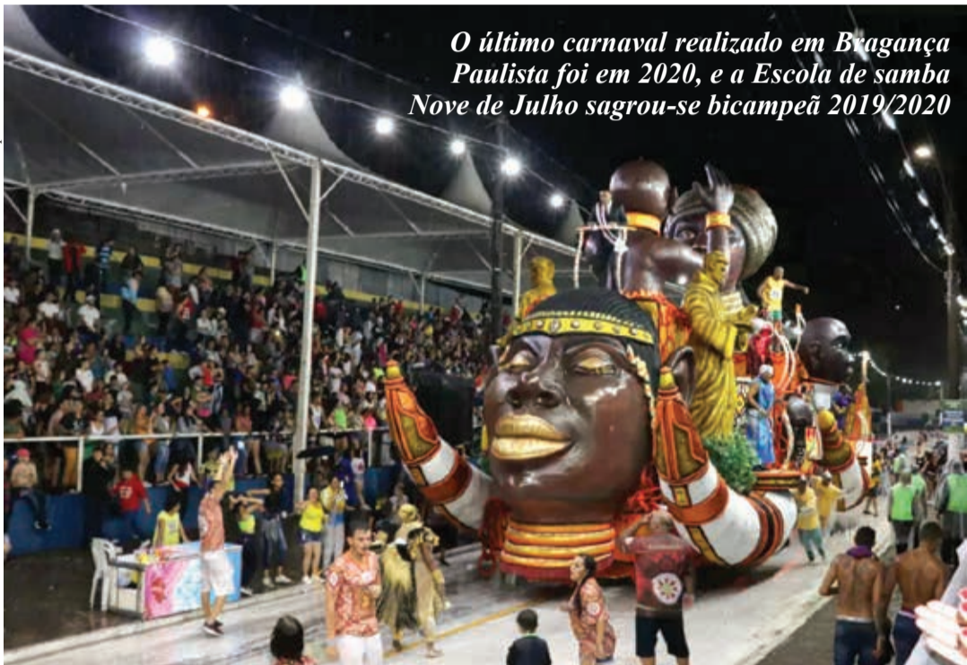
O último carnaval realizado em Bragança Paulista foi em 2020, e a Escola de samba Nove de Julho sagrou-se bicampeã 2019/2020

Dr. Lourenço Quilici (Lourenção). Os interessados em concorrer aos títulos de Rainha, 1ª e 2ª Princesa, Rei Momo e Sambista de Ouro devem preencher uma ficha de inscrição na sede da Secretaria de Cultura e Turismo, às 17h, ou formulário virtual (o site será publicado nos próximos dias). O período de candidatura é de 9 a 18 de janeiro. CADASTRO DOS BLOCOS Os trios elétricos que vão participar do desfile dos blocos de carnaval precisam se cadastrar por meio de formulário on-line ou cadastro presencial na Secretaria de