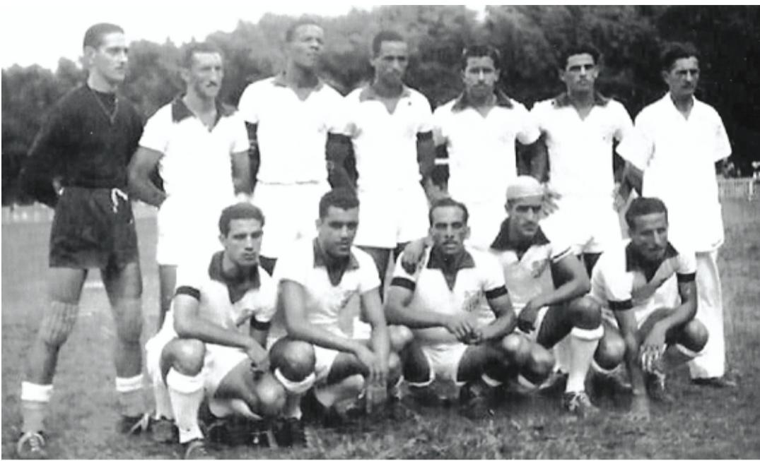
PRIMEIRA FORMAÇÃO OFICIAL DO C. A. BRAGANTINO COMO TIME PROFISSIONAL EM 1949