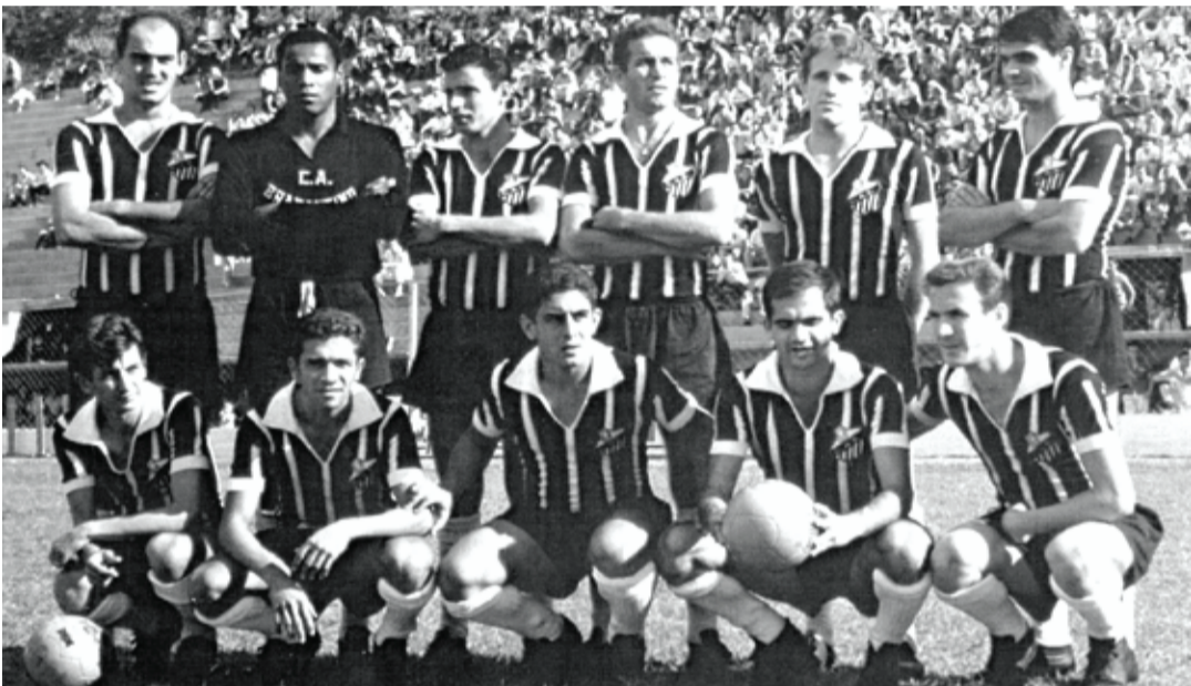
UMA DAS FORMAÇÕES DO BRAGANTINO QUE DISPUTOU PELA PRIMEIRA VEZ A ELITE DO FUTEBOL PAULISTA EM 1966