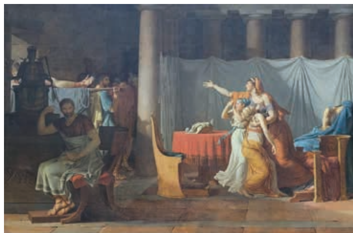
A obra “Os lictores trazendo para Brutus os corpos de seus filhos”, do pintor francês Jacques Louis David

É assim com as obras do pintor francês Jacques Louis David (1748-1825) – um dos representantes do neoclassicismo, nomeado pintor oficial de Napoleão – que nos atormenta e inquieta com um de seus trabalhos: “Os lictores trazendo para Brutus os corpos de seus filhos”, de 1789, no qual se interpreta a tragédia de Brutus, baseado na história de Roma.