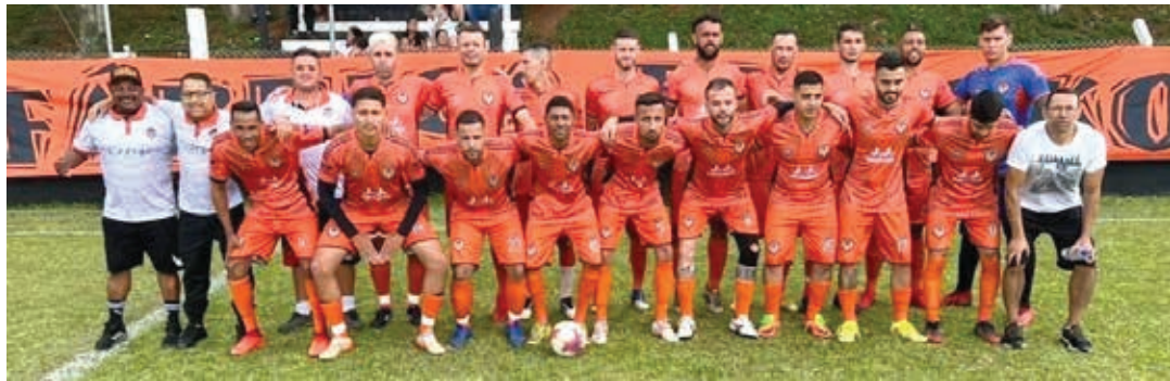
Já a segunda partida acontece às 11h e reúne as equipes do Cedega e Vila Aparecida