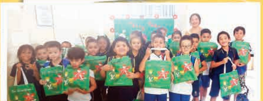
As crianças se divertiram e enriqueceram seus conhecimentos com as atividades proporcionadas pela escola