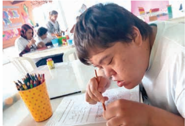
Aluno durante atividade no Projeto Casulo, em Bragança

O deputado Edmir Chedid (União) irá repassar mais R$ 1 milhão a entidades de assistência e desenvolvimento social. O recurso financeiro será liberado a partir das emendas impositivas do parlamentar indicadas ao orçamento estadual.