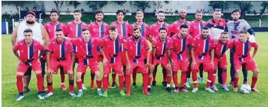
No primeiro jogo da semifinal se enfrentam, às 9h, União Vila Edna e Grêmio São Miguel