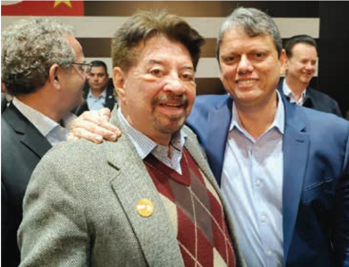
O prefeito Amauri Sodré participou de solenidade no Palácio dos Bandeirantes, ao lado do governador Tarcísio de Freitas

cessos estão em conformidade na Caixa Econômica Federal e, em breve, os contratos serão assinados. O reinício das obras do empreendimento está programado para 5 de junho deste ano.