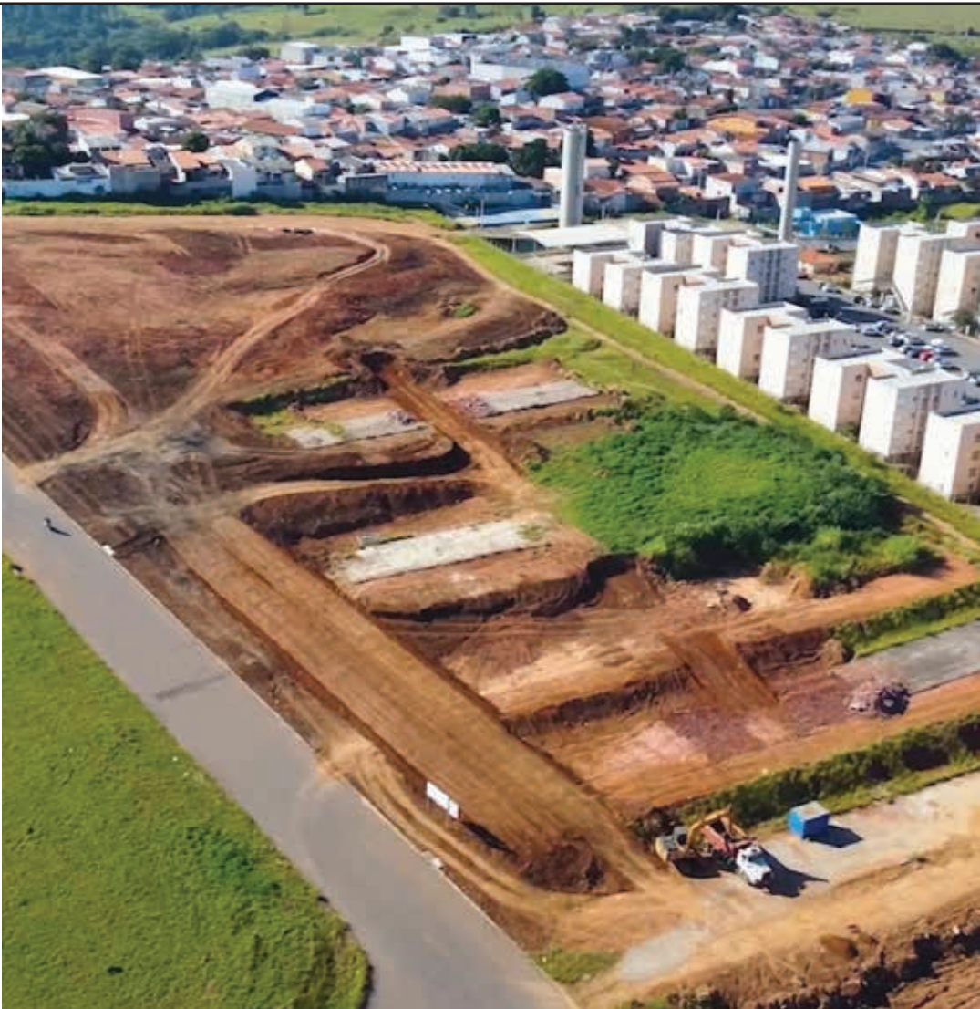
O novo empreendimento está em fase de terraplanagem e tem previsão de entrega para 2024, e vai beneficiar 240 famílias de baixa renda