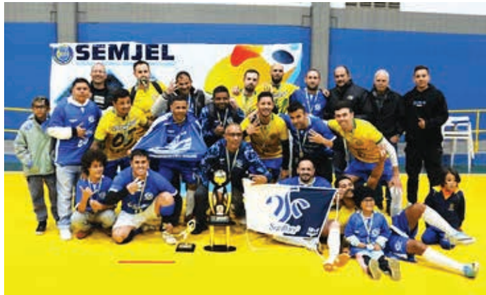
Time A da Santher é o atual campeão do Torneio dos Trabalhadores

Grupo A: Santa Casa, Quantum Nutri, Plásticos Luconi, Universidade São Francisco, Santher B e Cross Connection. Grupo B: Willtec, Roma, Dog Star