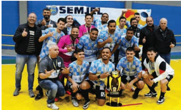
Equipe da Santa Casa foi a vice-campeã em 2022

A cerimônia de abertura do torneio contará com a apresentação das 22 equipes, entrada dos atletas em quadra e execução dos hi-