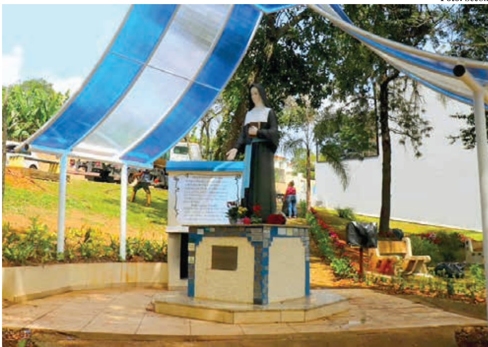
Em Bragança Paulista, a imagem de Santa Paulina está localizada na Avenida Antônio Pires Pimentel, confluência com a Rua Viscondessa da Cunha Bueno

A congregação foi se expandindo e, no ano de 1903, Madre Paulina mudou-se para São Paulo, onde iniciou uma obra de assistência aos escravos libertos e seus filhos. Seis anos depois, deixou o cargo de madre superiora e foi trabalhar com os doentes da Santa Casa e os idosos do Asilo São Vicente