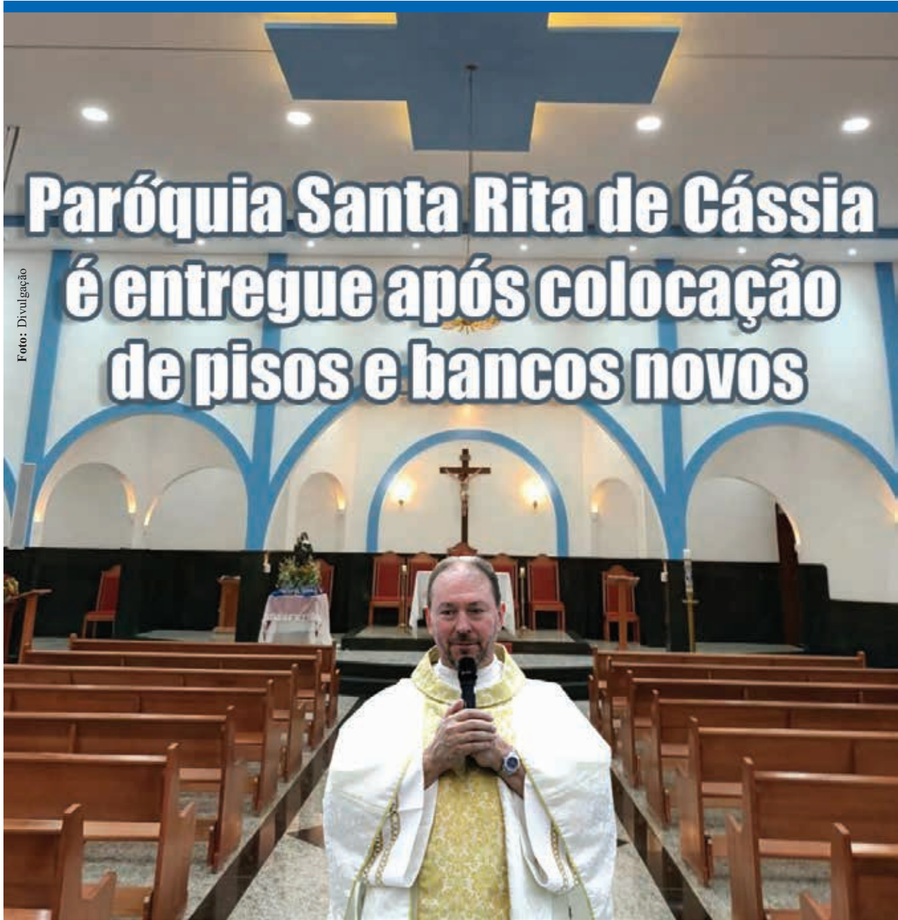
Antecipando as comemorações pelos seus dez anos, a Paróquia Santa Rita de Cássia, no Bairro Jardim da Fraternidade foi entregue finalizada, após a inauguração do piso e dos novos bancos. A noite contou com procissão, quermesse e a presença de um grande número de fiéis, que prestigiaram o momento histórico para a comunidade. Saiba mais detalhes.

Envio de documentação referente à prova de títulos: 15 de maio a 12 de junho de 2023. Envio da videoaula referente à prova prática: 15 de maio a 20 de julho de 2023. Aplicação da prova objetiva e discursiva: 6 de agosto de 2023. Divulgação do gabarito da prova objetiva: 10 de agosto de 2023.