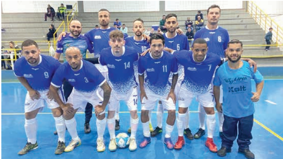
Time da VS Lima "A"

Na noite da última terça-feira, 6, mais duas partidas movimentaram o Ginásio Municipal de Esportes Rubens Batazza, na Plançada II, encerrando a primeira rodada da 37ª edição do Torneio dos Trabalhadores 2023. Ao todo, foram realizados dez jogos, totalizando 75 gols marcados, com uma média de 7,05 gols por par-