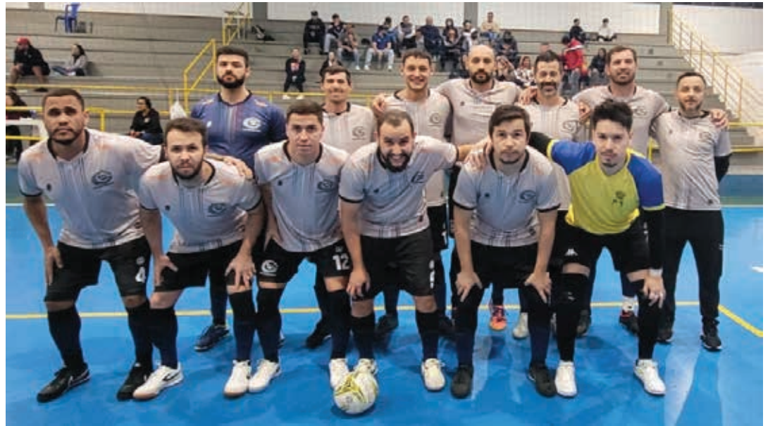
Equipe da Santher "B"

20h45 – Grupo D – Capricórnio Têxtil x Acetech – Ginásio Rubens Batazza