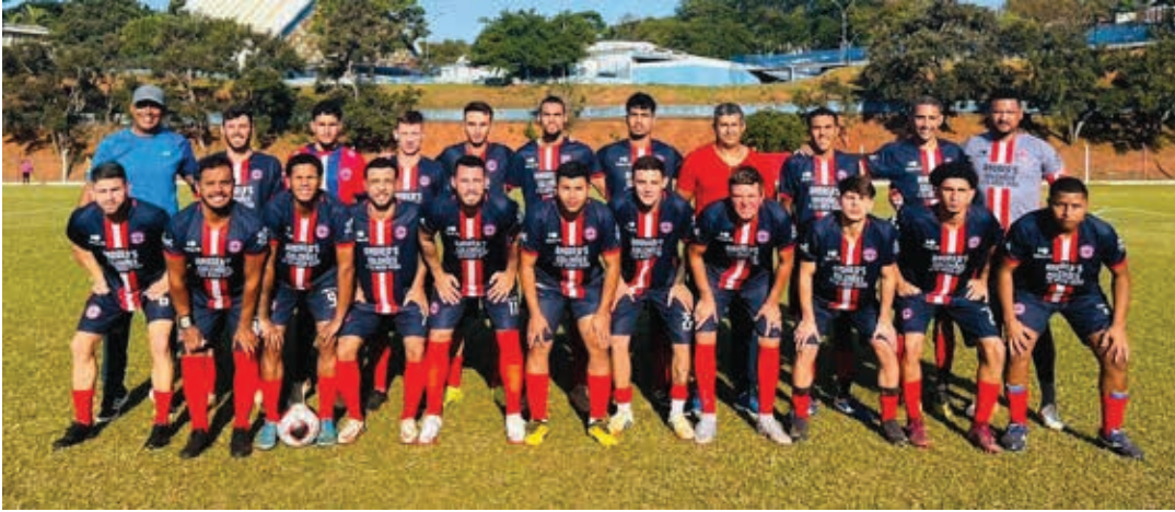
Querendo a vitória, Nacional e Vila Edna se enfrentam hoje à tarde, no campo do Bairro do Toró

Na tarde de hoje, às 15h15, oito jogos movimentam os gramados dos estádios na cidade e na zona rural, com a realização da terceira rodada do Campeonato Amador da Série A de 2023. Confira os duelos: No estádio Mário Guilherme dos Santos, o Cruzeiro enfrenta o Unidos.