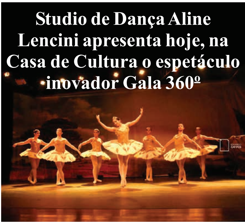
Na foto, a apresentação do espetáculo realizado na não passado, que foi um sucesso