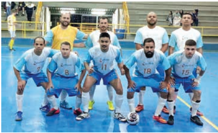
Universidade São Francisco e Energisa, estão na final da Série Prata