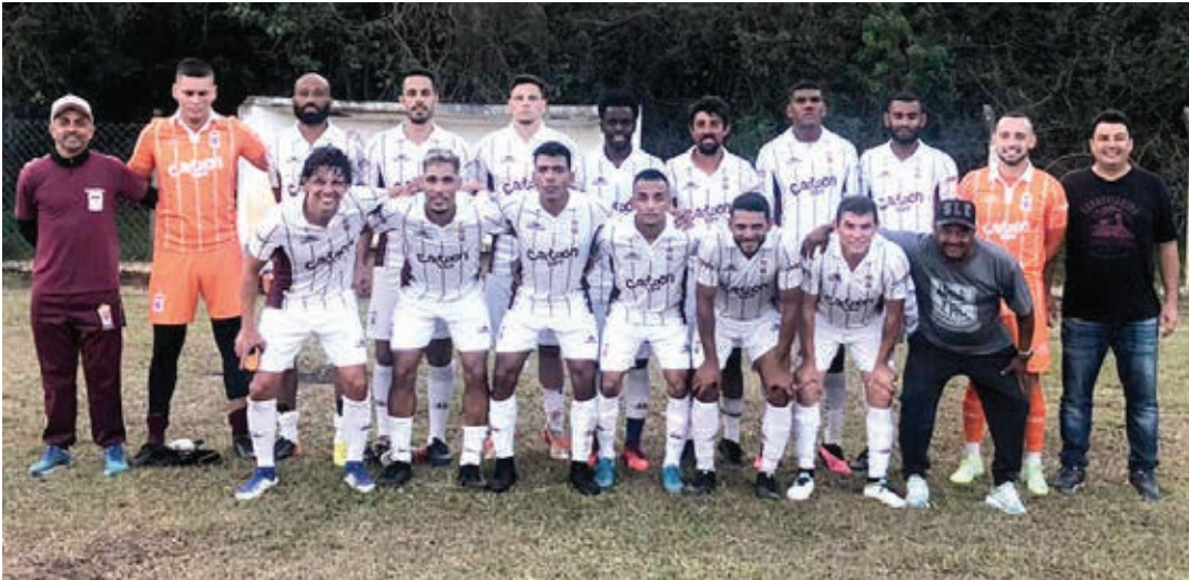
São Lourenço e Ferroviários disputam na tarde de hoje, o principal jogo da quarta rodada do Amadorzão 2023

A quarta rodada do Campeonato Amador da Série A 2023 terá um duelo de “gigantes” entre São Lourenço e Ferroviários, que se enfrentam neste sábado, 22, no Estádio Mário Guilherme dos Santos. A partida, válida pelo Grupo B, tem início às 15h15 e promete atrair um grande público. Pela tradição que ambas