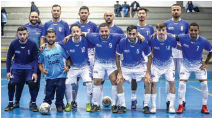
Santher e VS Lima vão decidir o título da Série Ouro

SEMIFINAIS DA SÉRIE PRATA Nesta semana, foram definidos os quatro times finalistas das Séries Prata e Ouro da 37ª Edição do Torneio dos Trabalhadores de Futsal 2023, uma competição promovida e organizada pela Prefeitura Municipal, por meio da Secretaria Municipal da Juventude, Esportes e Lazer (Semjel/Bragança). Na terça-feira, 18, aconteceram os jogos das semifinais da Série Prata. No pri-