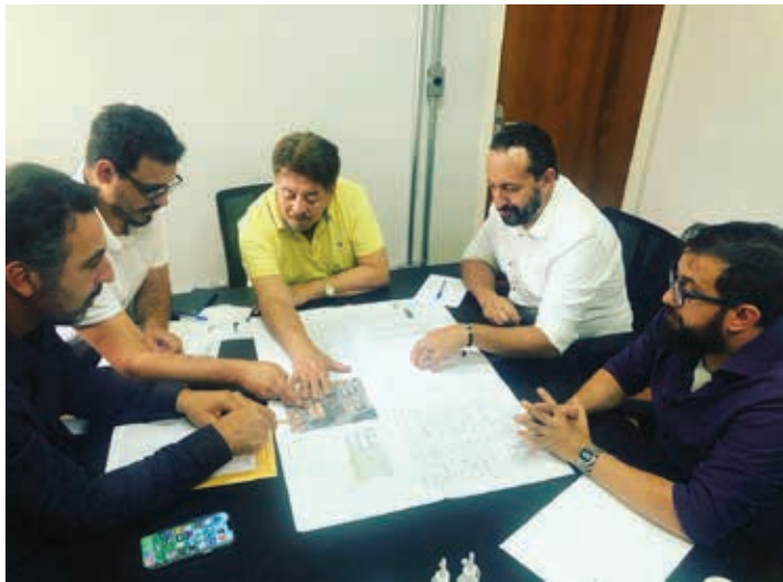
Parceria de sucesso: A Prefeitura e a Acohab uniram esforços para viabilizar mais moradias populares em Bragança Paulista

A Administração anunciou, nesta semana, subsídio de R$ 8 mil por família para os futuros moradores do Conjunto Habitacional Elis Regina e Renato Russo