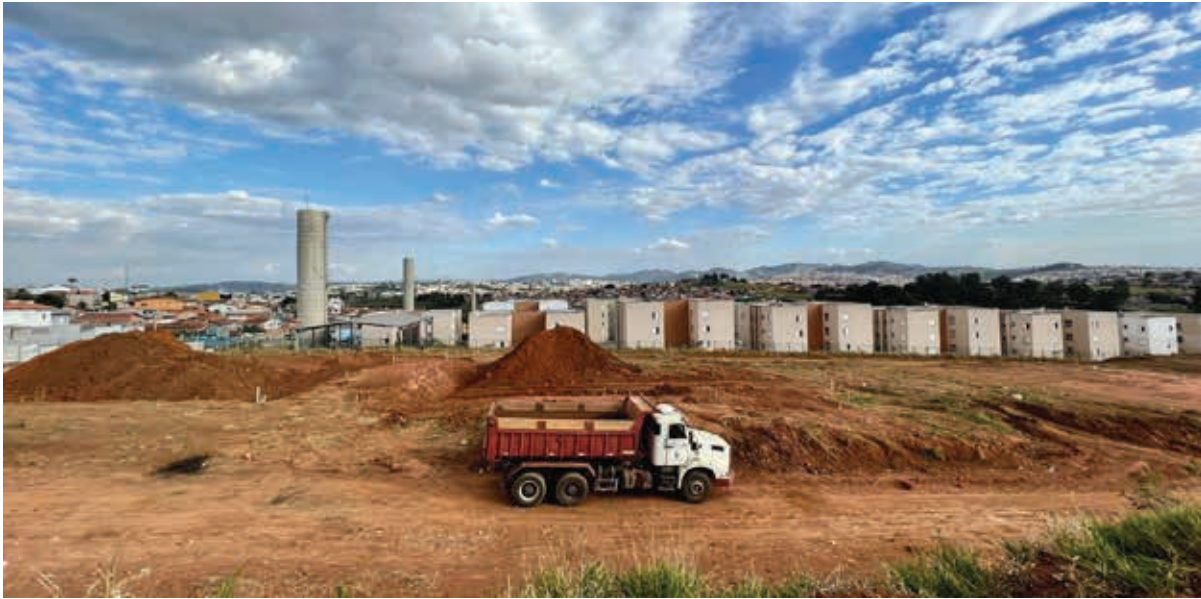
A área para a construção dos 560 apartamentos do Conjunto Habitacional Elis Regina e Renato Russo foi doada para a Acohab durante o mandato do então prefeito Jesus Chedid

A área do terreno, com 32.793,18 metros quadrados no Jardim Águas Claras, foi doada na gestão do prefeito Jesus Chedid, em 2002. Após 19 anos, Jesus deu a aprovação para a construção de 560 apartamentos, sendo que uma área adicional de 33.167,51 metros