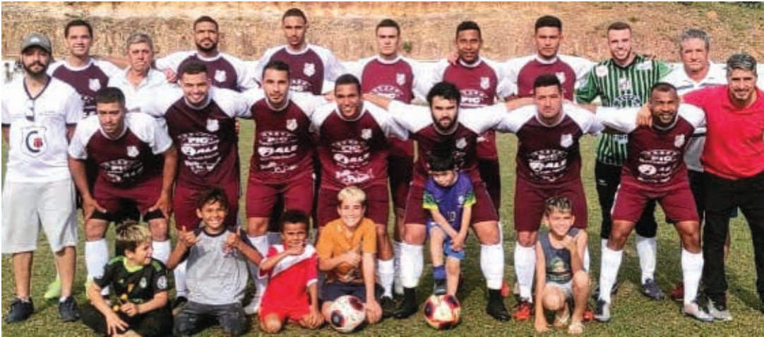
Tuiuti precisa vencer o jogo por qualquer placar

O Campeonato Amador de Bragança está chegando à reta final da temporada 2023, quando será coroado o grande campeão. No entanto, antes disso, os quatro times semifinalistas—Nacional do Toró, Vila Aparecida, Ferroviários e Tuiuti—terão que lutar em campo pela oportunidade de avan-