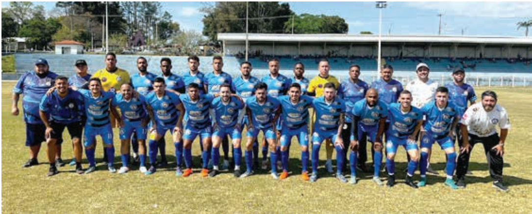
Vila Aparecida joga por um empate para chegar na final