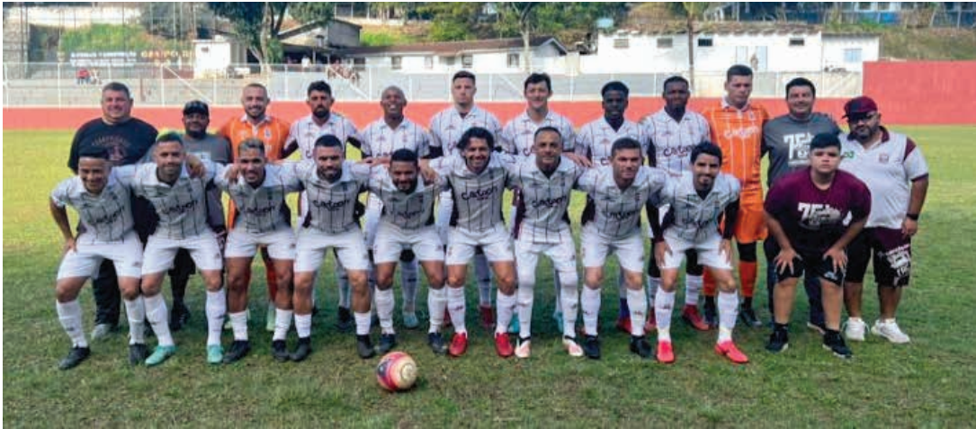
Ferroviários necessita de uma vitória por dois gols