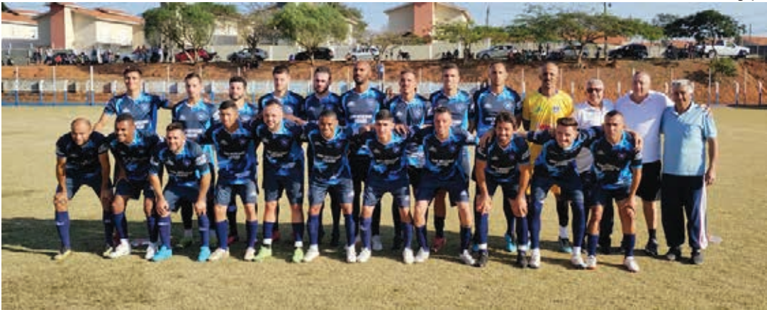
Nacional pode até perder por um gol de diferença