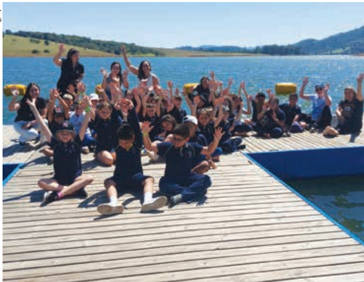
Equipe gestora, professores e alunos da E.M. Augusto Vasconcellos na Estância Marina Confiança

e desenvolvimento da cidade, desde o início de sua formação até os dias atuais. Encantaram-se ao conhecer um pouco do turismo náutico na Estância Marina Confiança e toda beleza e grandeza do Sistema Cantareira que abastece a Grande São