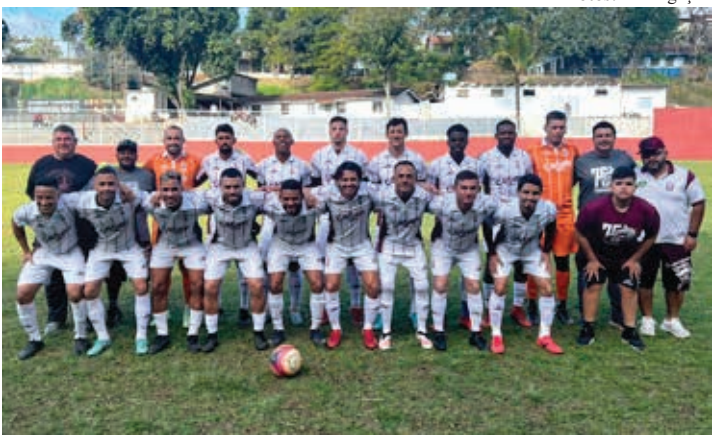
Time do Ferroviários busca o hexacampeonato (seis títulos consecutivos) e o 19º em sua história