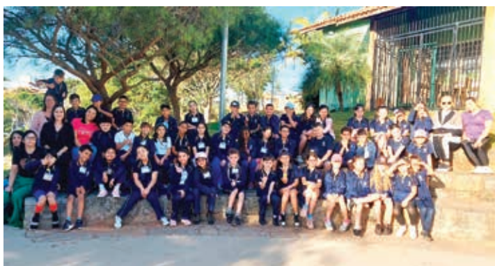
Escolas participantes do Projeto Piloto no Parque Refúgio das Aves

mentos sobre a história do município. Tiveram a oportunidade de visitar a Fazenda Boa Esperança e conhecer todo processo de produção do café, da plantação até a mesa, aprendendo sobre a importância do cultivo desses grãos para economia