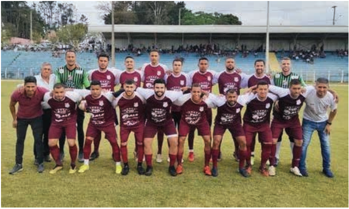
Já a equipe do Tuiuti, que volta a disputar uma final do principal Campeonato Amador de Bragança após 40 anos, tenta o segundo caneco