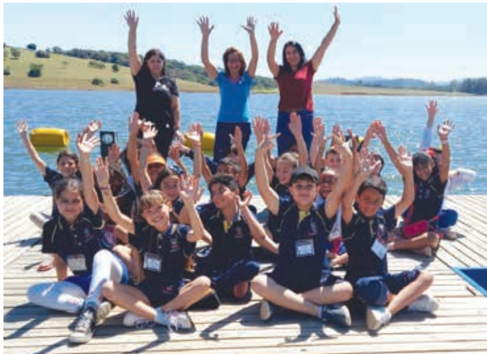
Professoras e alunos da E.M. Luiz Gonzaga Fernandes na Estância Marina Confiança

Os estudantes já visitaram o Parque Refúgio das Aves, Lago do Taboão, Lago dos Padres, Jardim Público, despertando um olhar para as belezas naturais e a importância de sua preservação. Além disso, conheceram o Museu do Telefone, Museu Oswaldo Russomano e o Centro Cultural Prefeito Jesus Adib Abi Chedid, enriquecendo seus conheci-