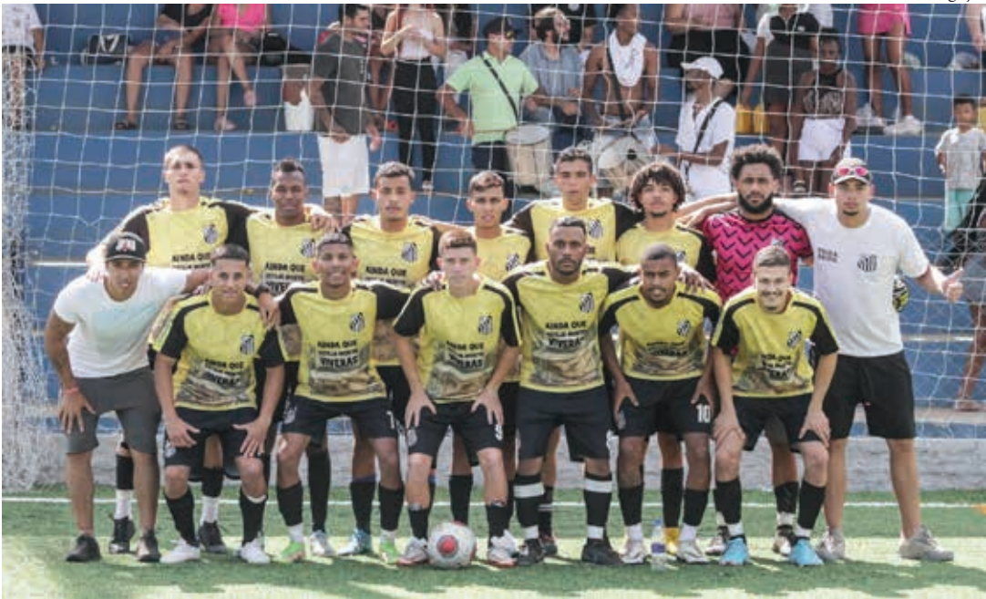
Time do Poka Roupa venceu os três jogos que disputou e está com 100% de aproveitamento no campeonato

13h45: Hípica Jaguarí x Água Comprida (Grupo A) 15h45: Menin x Vila Garcia (Grupo B)