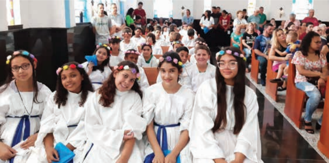
Igreja ficou lotada para celebrar o Dia da Padroeira