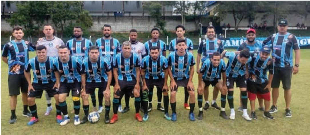
Time do Grêmio São Miguel lidera o Grupo A, com 7 pontos ganhos