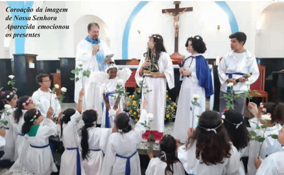
Coroação da imagem de Nossa Senhora Aparecida emocionou os presentes

Ao término da celebração, houve festa em comemoração ao Dia das Crianças.