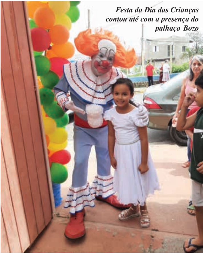
Festa do Dia das Crianças contou até com a presença do palhaço Bozo