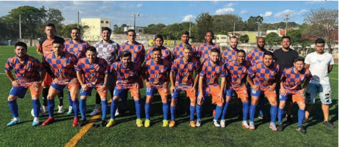
Equipe do Jardim Iguatemi ocupa a quarta posição no Grupo A, com 5 pontos

A Liga Bragantina de Futebol (LBF) e a Secretaria Municipal da Juventude, Esportes e Lazer (Semjel-Bragança), organizadores do Campeonato Amador da Série B de Bragança, marcaram, para este domingo, 15, a disputa da 5ª rodada. Ao todo, serão seis jogos que ocorrem nos campos do Santa Luzia, Internacional da Mãe dos Homens e Menin. O início da preliminar está agendado para as 13h45 e o jogo principal às 15h35. Vale mencionar que as equipes do Morro Grande, do Grupo A, e Poka Ropa, do Grupo B, estarão de folga.