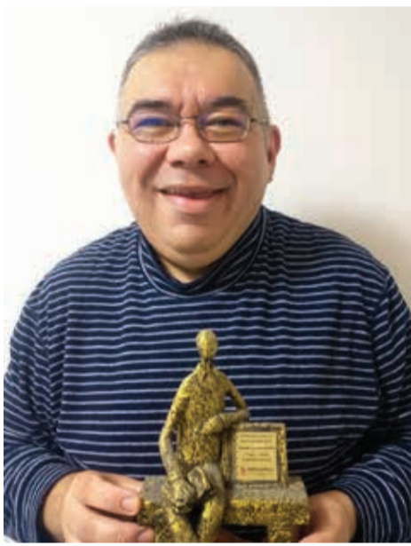
O escritor com seu primeiro troféu Mario Quintana, que recebeu em 2016 pelo primeiro lugar na categoria Crônica Nacional

Os textos vencedores do Concurso Literário Mario Quintana são divididos nas modalidades Regional e Nacional, e integrarão o livro “Mal rompe a manhã” (que contará com uma sessão de autógrafos no dia 11 de novembro, às