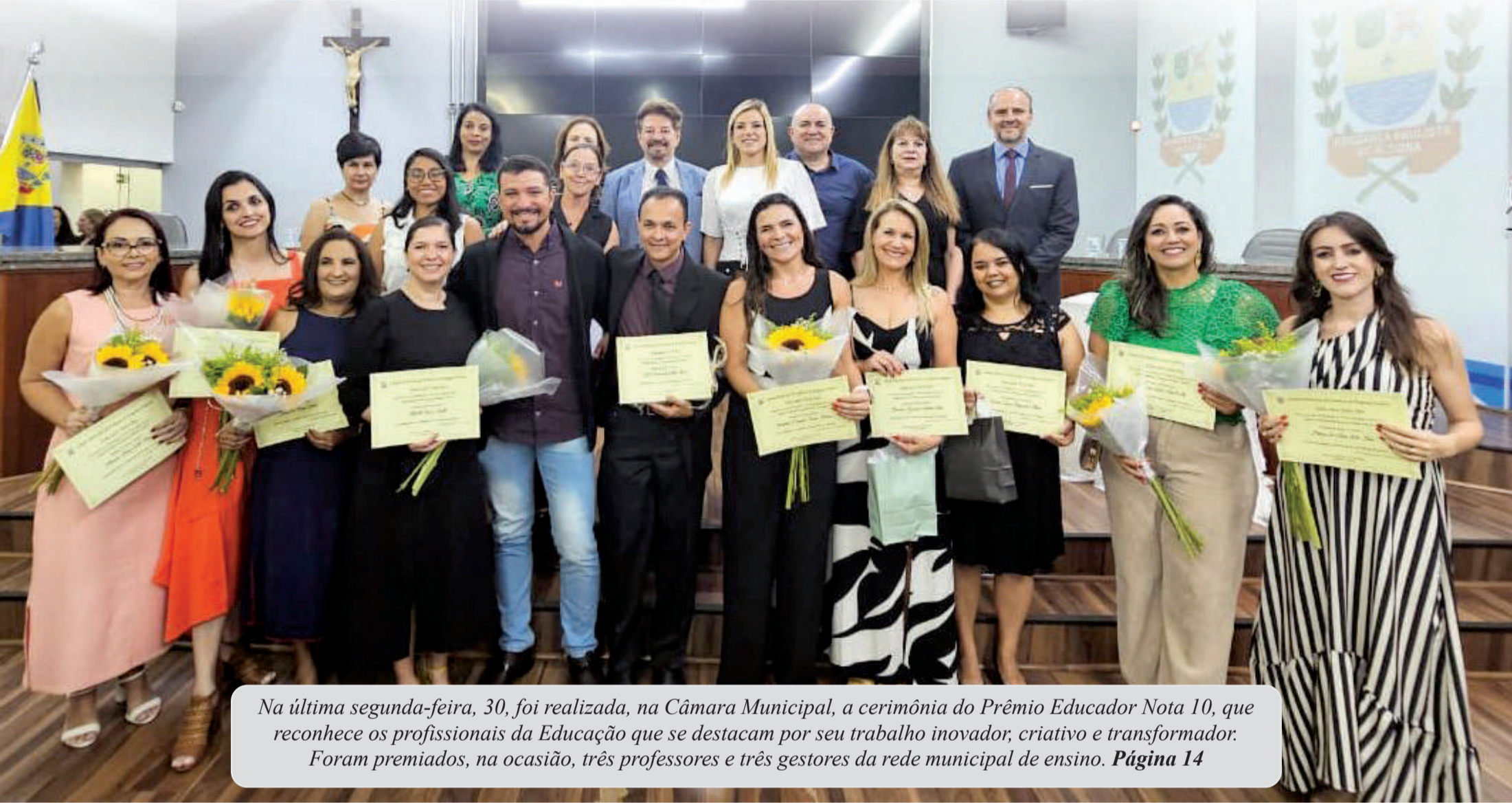
Na última segunda-feira, 30, foi realizada, na Câmara Municipal, a cerimônia do Prêmio Educador Nota 10, que reconhece os profissionais da Educação que se destacam por seu trabalho inovador, criativo e transformador. Foram premiados, na ocasião, três professores e três gestores da rede municipal de ensino. Página 14