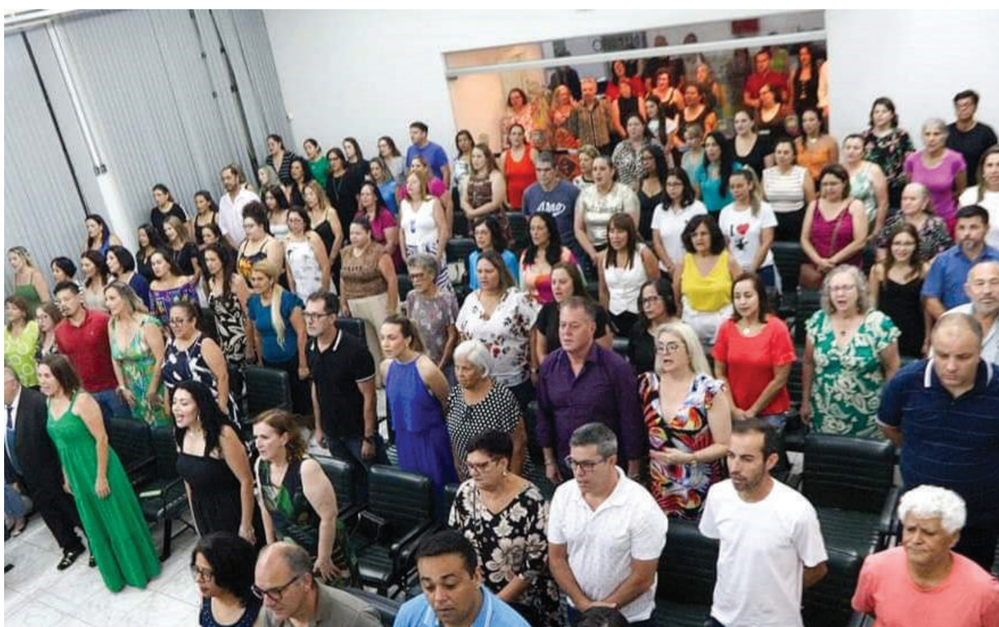
Parentes e amigos dos educadores prestigiaram a cerimônia de premiação