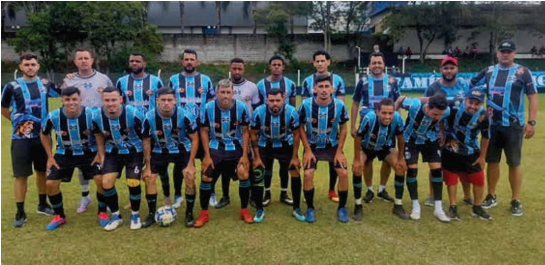
Time do Grêmio São Miguel vai enfrentar o Menin amanhã no campo do Santa Luzia

ressaltar que os confrontos serão únicos e ocorrerão em rodada dupla nos Estádios Lincoln Rodrigues Siqueira (campo do Santa Luzia) e Raul Monteiro (campo do Vila