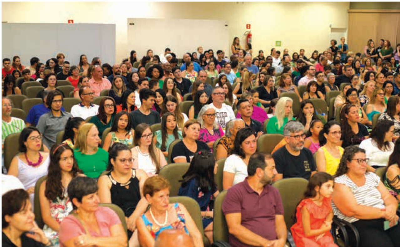
Famílias e amigos lotaram o salão da EBRAFA para prestigiar os vencedores