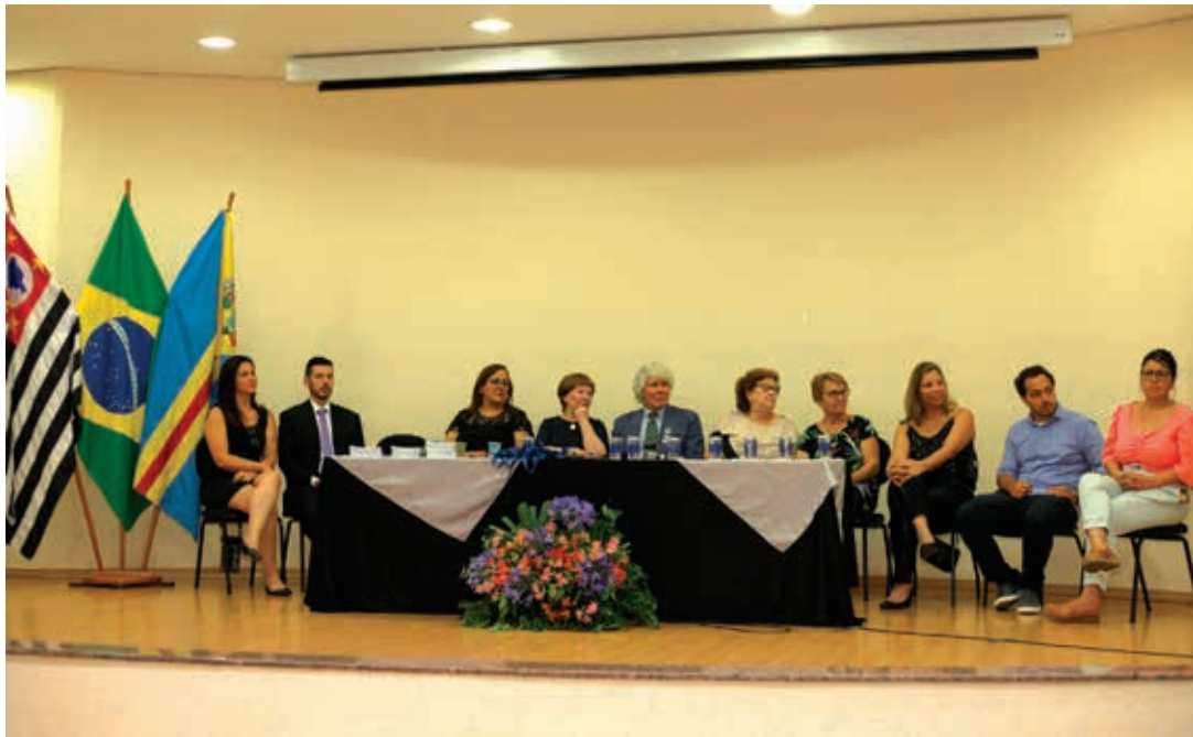
Escritores, convidados e colaboradores compuseram a mesa de honra