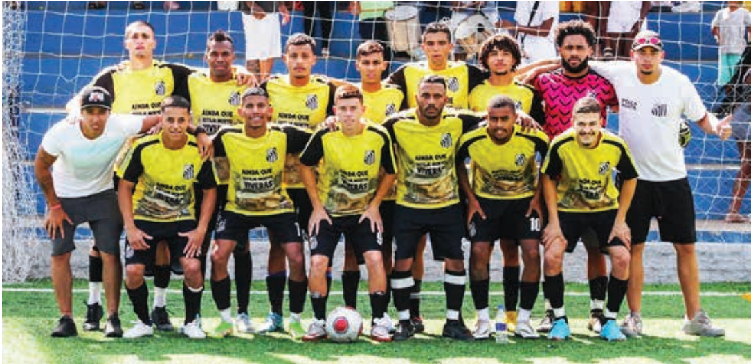
Equipe do Poka Ropa vai defender a invencibilidade no campeonato contra o Água Comprida

Amanhã começam os jogos da fase eliminatória do Campeonato Amador da Segunda Divisão de Bragança. Apenas oito times continuam na disputa pelo título. A Liga Braganti-