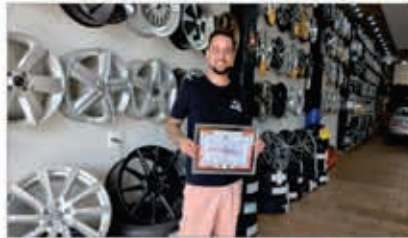
NENESCAR AUTO CENTER

Av. José G. da Rocha Leal, 1895 Fone 2473-5713