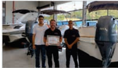
SUNRISE AUTOS & NÁUTICA

Lancha - Jet Ski - Motor de Popa Acessórios Náuticos Veículos Nacionais e Importados