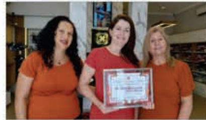
A SENSUAL MODA ÍNTIMA

Rua Advogado Zeferino Vasconcelos, 52 Fone 4032-9182