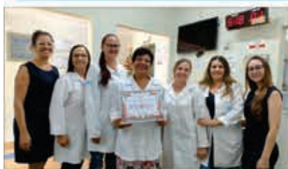
CBI LABORATÓRIO MÉDICO Centro de Bioanálises Integradas

A qualidade do produto, o trato para com os clientes, a honestidade nos negócios são fatores que contribuem de maneira destacada na confirmação e consagração de uma empresa. Com base nestes e outros itens a STATUS PUBLICIDADE E PESQUISA realizou junto à comunidade BRAGANTINA uma enquete popular respeitando critérios científicos de avaliação com a indicação de empresas e profissionais que atuam com excelência no comércio de BRAGANÇA PAULISTA . Confira nas fotos os principais momentos da solenidade de entrega do Prêmio Destaque Empresarial às Empresas que se Destacaram na Pesquisa de Satisfação em BRAGANÇA PAULISTA - SP .