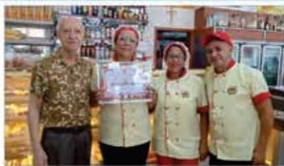
PADARIA 9 DE JULHO

Panificadora e Confeitaria Restaurante Self-Serve O Sabor da Qualidade