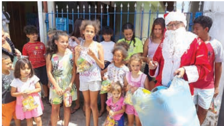
Jardim do Cedro