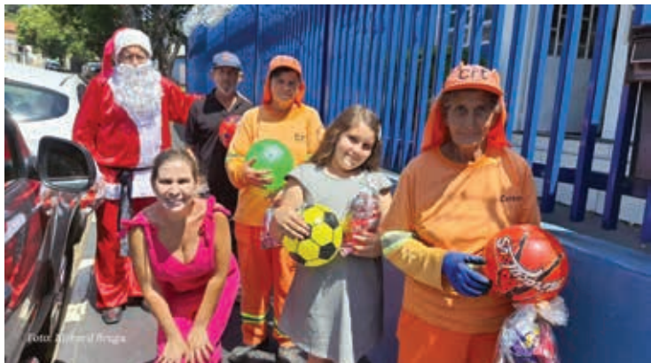
Início da carreta no Sindicato do Papel