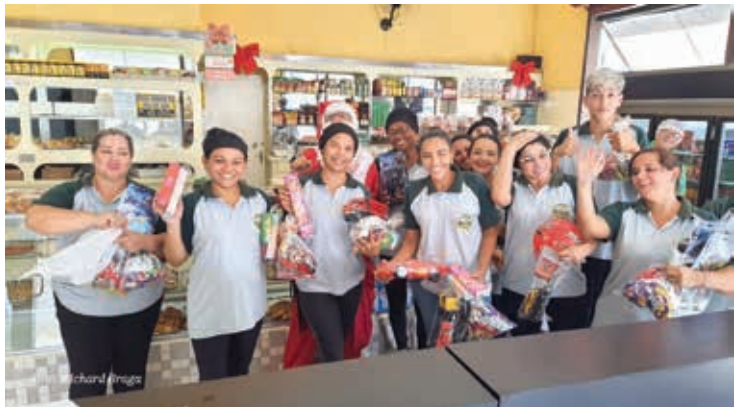
Encontro na Padaria Padre Aldo