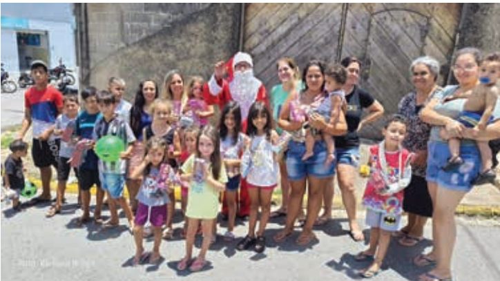
Jardim da Fraternidade