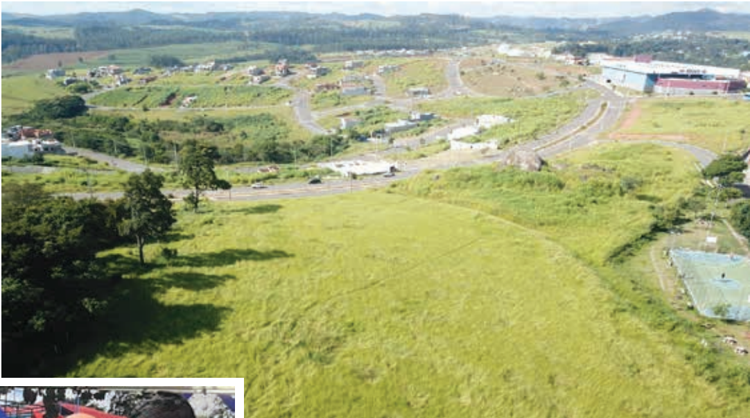
Terreno da creche do Jardim Bonança

“As creches que conquistamos desempenham um pa-