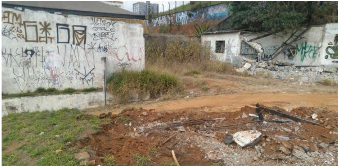
O terreno de 2.942,53m² localizado na Zona Sul da cidade é o mais valioso do leilão