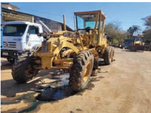
O leilão possui veículos de passeio, maquinário e caminhões pesados