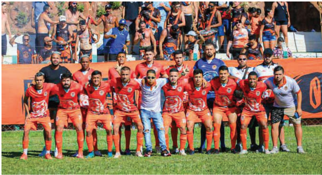
Cedega e Rebuc se enfrentam às 13h45 na primeira semifinal do dia