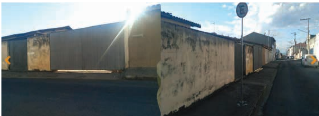
Já o imóvel com mais lances até o momento está situado na rua Verão, no bairro do Cruzeiro, com uma área de 200m²