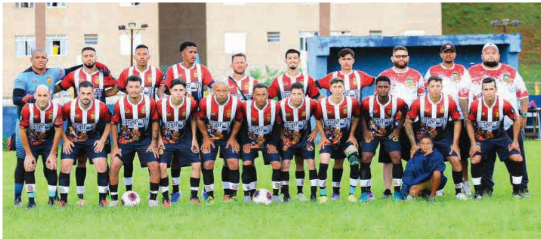
Logo em seguida, às 15h45, jogam Bucks Park e Grêmio Jardim Recreio