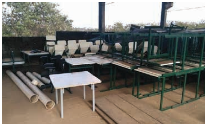
Também serão leiloadas muitas sucatas