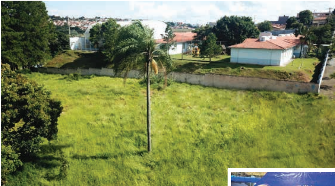
Terreno da creche da Planejada II

Na segunda-feira, 22, as Secretarias Municipais de Educação e de Obras realizaram a assinatura das ordens de serviço para a construção de duas novas creches: no Jardim Bonança e na Planejada II.