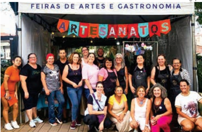
Diversos expositores já confirmaram presença. Acompanhe seus trabalhos pelo Instagram:

No próximo sábado, 13 de abril, a Arte na Garagem estará de volta na Praça Princesa Isabel, em frente à Igreja do Rosário, no Centro, para mais uma feira mensal. O evento acontecerá das 9h às 18h, com entrada gratuita para o público. Os visitantes poderão conferir e adquirir artigos exclusivos de artesanato, além de deliciar-se com doces e salgados. O principal objetivo da feira é promover o trabalho de mulheres artesãs e empreendedoras de Bragança e região.