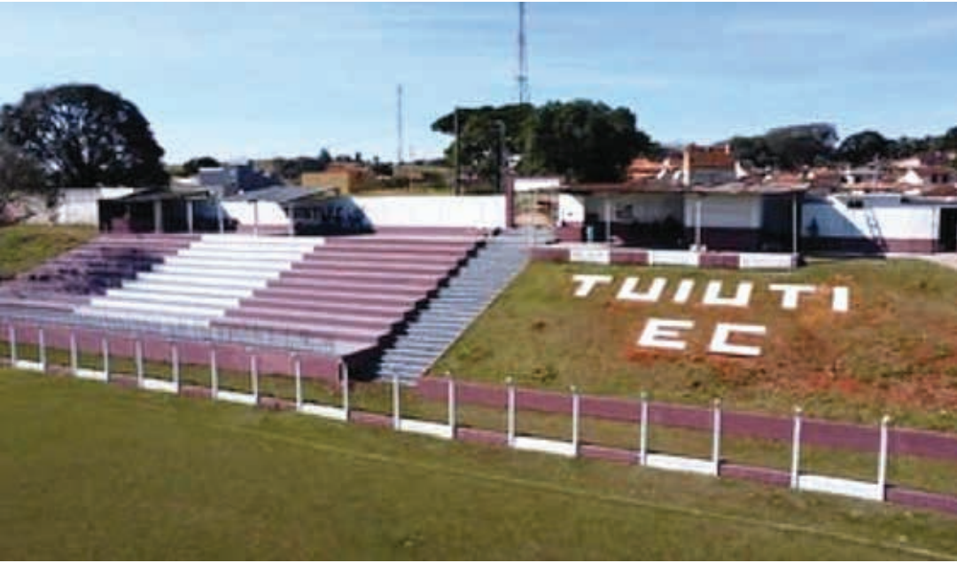
Estádio José Pascoal Brando, na cidade de Tuiuti, será o palco do principal duelo da rodada de hoje