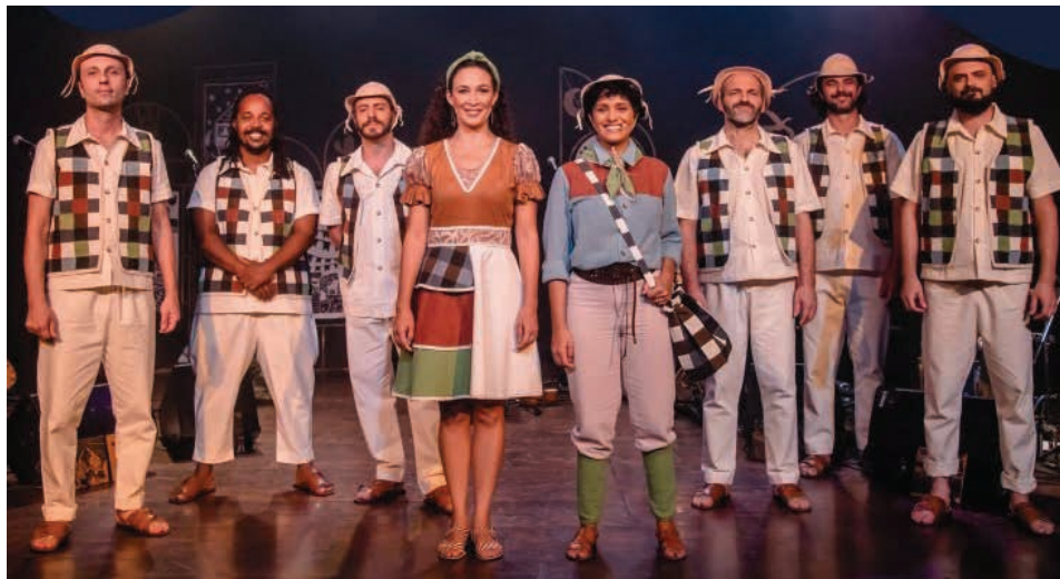
Espetáculo “Cordel Viajante”

A segunda semana do Maio Cultural continua neste final de semana com uma programação que inclui espetáculo teatral, palestra, lançamento de evento e show sertanejo raiz. Confira abaixo: