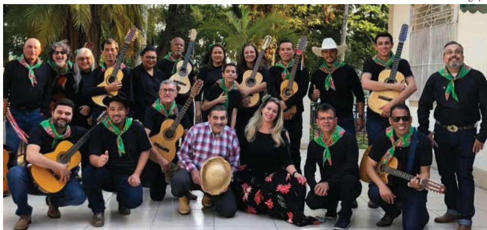
O Grupo Cultural “Flor de Chitão”