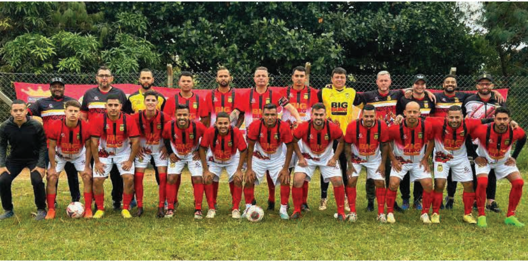
Time do Bucks Park, que estreou no campeonato com goleada sobre o Pinhalzinho por 5 a 1

O Campeonato Amador da Segunda Divisão de Bragança (Amadorzão da Série B 2024) prossegue na tarde deste domingo, 2 de junho, com a realização da segunda rodada que será disputada nos campos do Menin, Santa Luzia, Vila Aparecida e Parque dos Estados. De acordo com a Liga Bragantina de Futebol (LBF), organizadora do campeonato, os jogos terão início às 13h45 (preliminar) e às 15h45 (jogo de fundo). Confira os duelos: