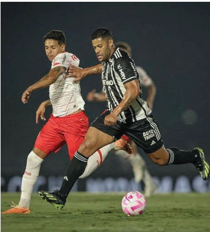
No Campeonato Brasileiro do ano passado, o Red Bull Bragantino foi derrotado em casa pelo Atlético Mineiro por 2 a 1

Sob o comando do técnico Pedro Caixinha, o Bragantino vem vivendo um bom momento. Na tabela do Brasileirão, a equipe soma 12 pontos e ocupa a sexta posição, enquanto o Atlético está em décimo, com dez pontos e um jogo a menos. O Bragantino vem de uma boa vitória fora de casa, vencendo o time reserva do Grêmio por 2 a 0, enquanto o Atlético-MG só empatou em casa com o Bahia por 1 a 1. Além do Brasileirão, o Braga vai enfrentar o Barcelona de Guayaquil-EQU nos playoffs da Sul-Americana, enquanto o Galo está classificado para as oitavas de final da Copa Libertadores, onde enfrentará o San Lorenzo, da Argentina.