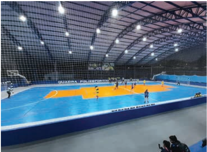
Quadra poliesportiva “João Brochetta”, no Complexo Esportivo Rivelino de Oliveira Dorta, receberá atletas durante os Jogos Regionais