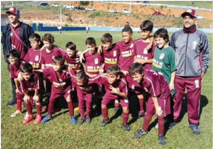
Time Sub-9 do Ferroviários