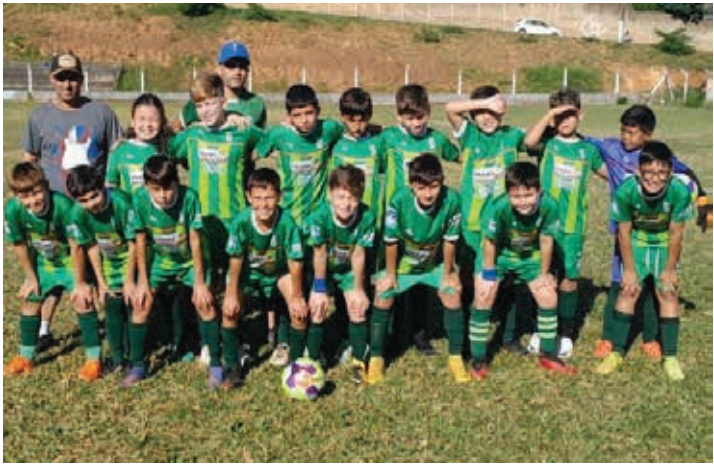
Categoria Sub-11 do Santa Luzia

Neste domingo, 16 de junho, será disputada a última rodada da fase de grupos do Campeonato Municipal de Menores 2024. Ao término das 12 partidas, serão conhecidos todos os times classificados para a próxima fase nas três categorias - Sub-9, Sub-11 e Sub-13.