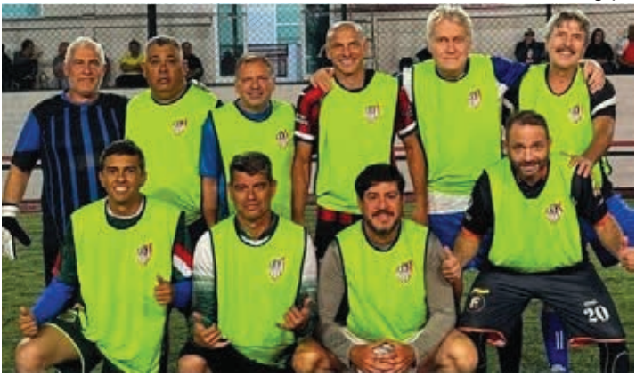
Equipe do Argentinos Juniors, Vice-Campeã