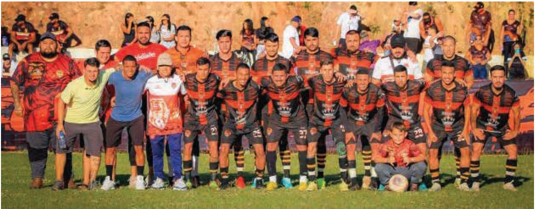
O time do Cedega enfrenta o Bucks Park neste domingo buscando manter os 100% de aproveitamento na competição

Neste domingo, 16, acontece a quarta rodada do Campeonato Amador da Série B de Bragança Paulista, com rodadas duplas nos campos da Vila Aparecida, Parque dos Estados e Santa Luzia, além de um jogo na cidade de Pinhalzinho. Ao todo, serão sete jogos, com início marcado para as 13h45 para a primeira partida e às 15h45 para o segundo confronto.