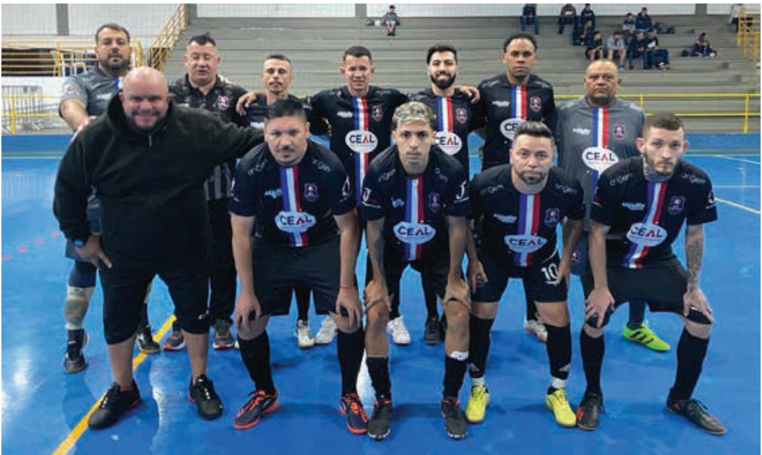
Centro de Alimentos campeão da Série Prata

Brasileiro e do Hino de Bragança Paulista.