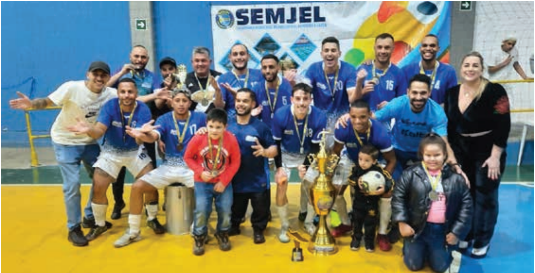
VS Lima campeão da Série Ouro