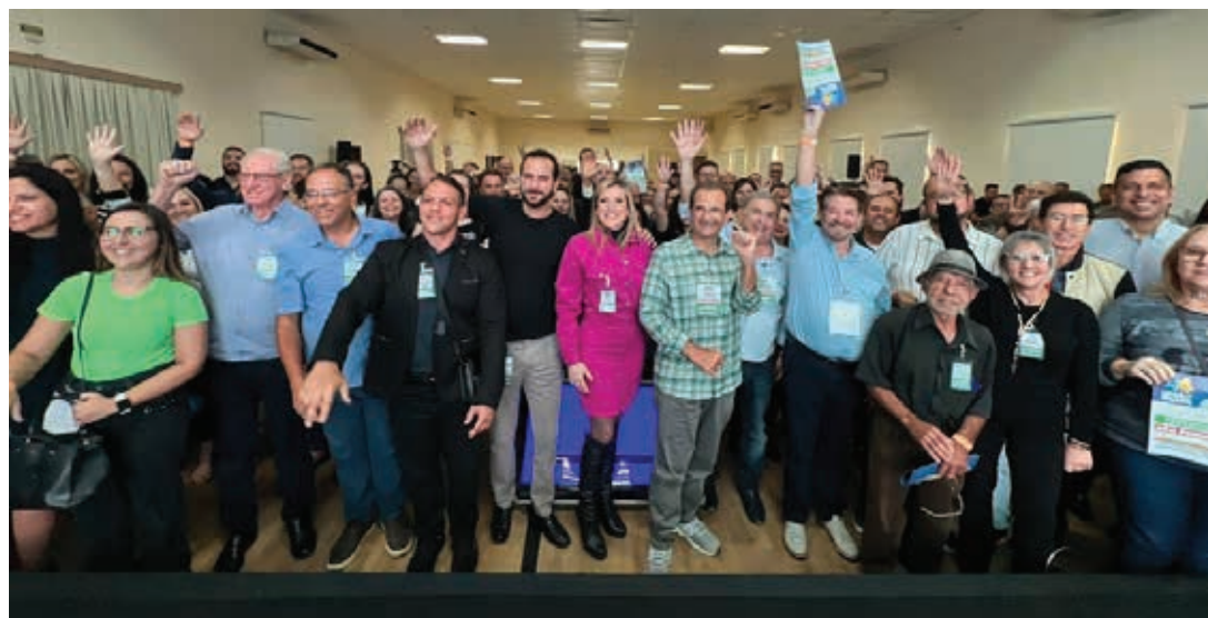
Grupo Chedid, liderado pelo deputado estadual Edmir Chedid, tem nove partidos coligados até o momento

A dois meses e meio das Eleições Municipais de 2024, os partidos políticos e suas coligações estão autorizados a realizar suas convenções partidárias a partir deste sábado, 20 de julho, até 15 de agosto. Essas convenções são cruciais para escolher os candidatos aos cargos de prefeito, vice-prefeito e vereador.