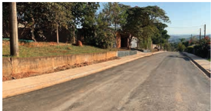
Rua Carlota Bertin Chiovatto