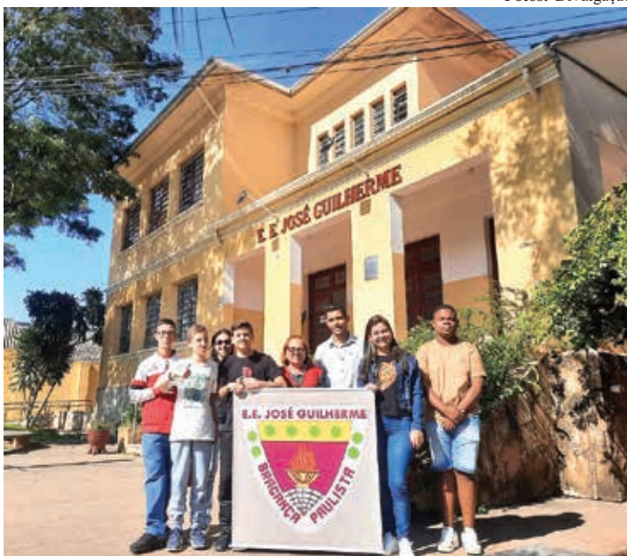
Equipe Sub-14 de xadrez da E.E. José Guilherme

O mês de agosto traz momentos decisivos nos Jogos Escolares do Estado de São Paulo (JEESP - 2024). Mais de 3.500 alunos das redes de ensino municipal, estadual e privada do estado começaram, na última quinta-feira, 1º, a disputar as finais da Categoria Sub-14.