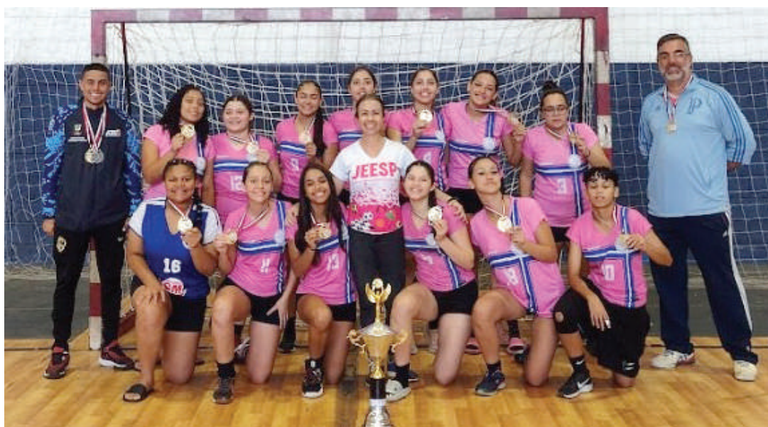
Equipe de handebol feminino da E.E. Silvio de Carvalho P. Júnior Douto

Os vencedores das etapas I e II se encontrarão no dia 18 deste mês na finalíssima (etapa IV), também nas mesmas cidades-sede. As escolas campeãs nas modalidades de futsal, basquete, handebol, vôlei, xadrez individual e tênis de mesa garantirão uma vaga nos Jogos Escolares Brasileiros Sub-14, que serão disputados no Recife (PE), entre 20 de setembro e 3 de outubro.