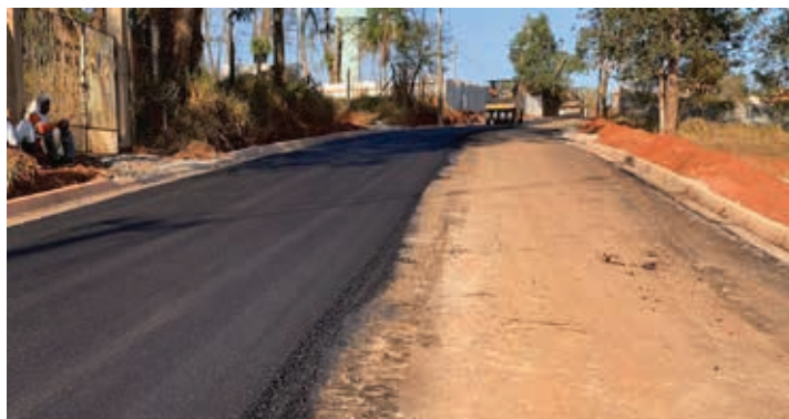
Rua Prof. Alfred John Bentley

A Prefeitura de Bragança Paulista, por meio da Secretaria Municipal de Obras, está realizando a pavimentação das ruas do Bairro Portal São Marcelo, localizado na região do Campo Novo, na divisa com Itatiba.