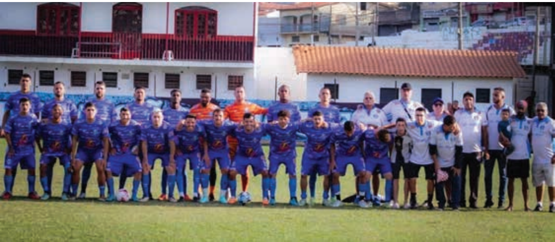
Time do São Miguel está invicto e tem a melhor campanha no campeonato

A final do Campeonato Amador Série B de Bragança Paulista, entre Grêmio São Miguel e Cedega, está marcada para este domingo, 11 de agosto, às 10h, no Estádio Mário Guilherme dos Santos (Campo do São Lourenço). A entrada será