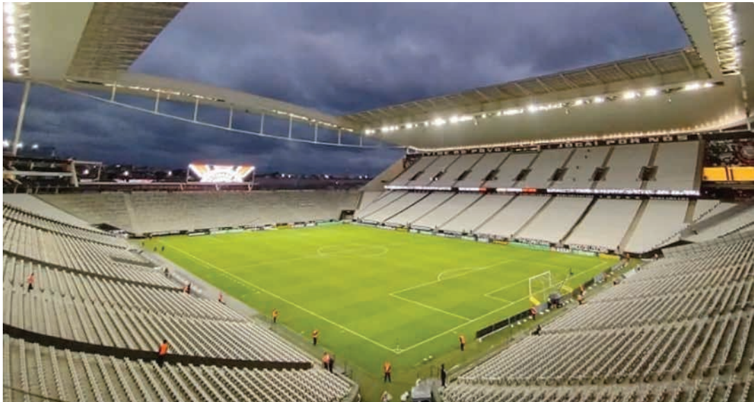
Pela 22ª rodada do Brasileirão 2024, Braga enfrenta o Corinthians hoje à noite na Neo Química Arena, em São Paulo