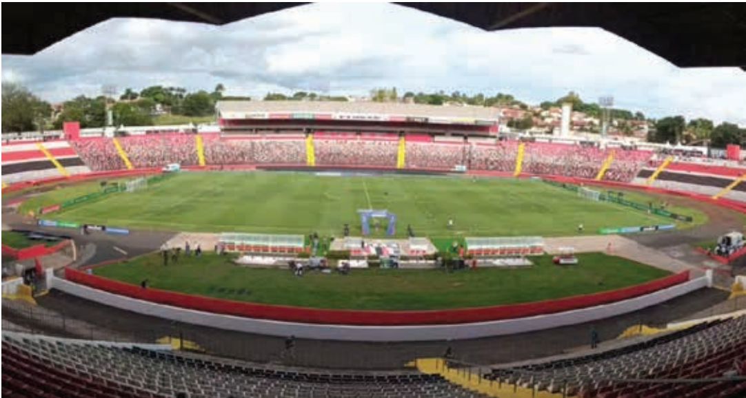
Já pela Copa Sul-Americana, na próxima terça-feira, 13, a partida contra o Timão acontece no Estádio Santa Cruz - Arena Nicnet, em Ribeirão Preto

Com a eliminação na Copa do Brasil, o Red Bull Bragantino agora vai focar todas as suas atenções no Campeonato Brasileiro e na Copa Sul-Americana, tendo como adversário nos próximos dois jogos o Corinthians.