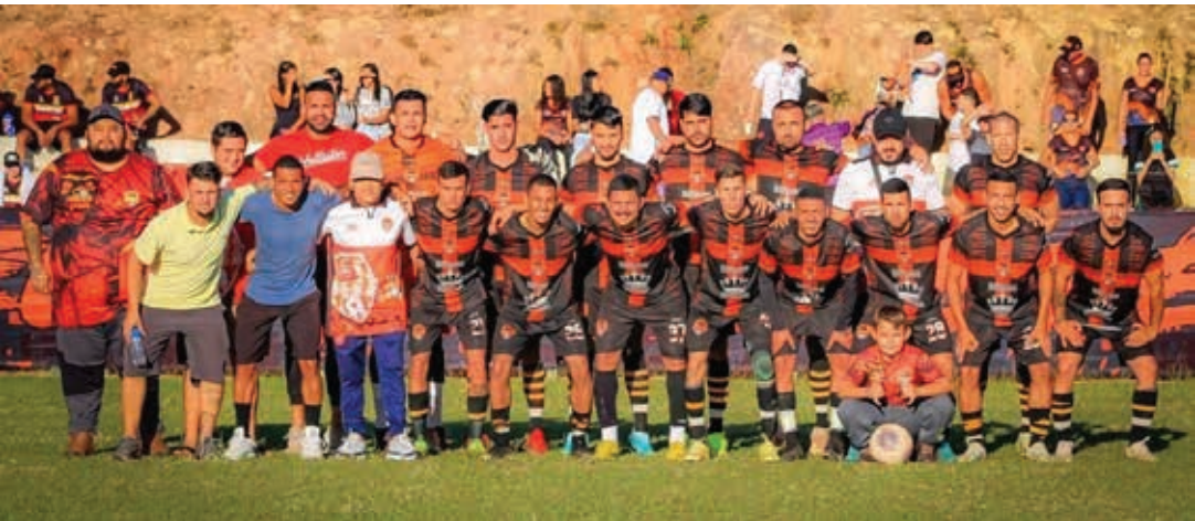
Equipe do Cedega chega para a decisão com apenas uma derrota