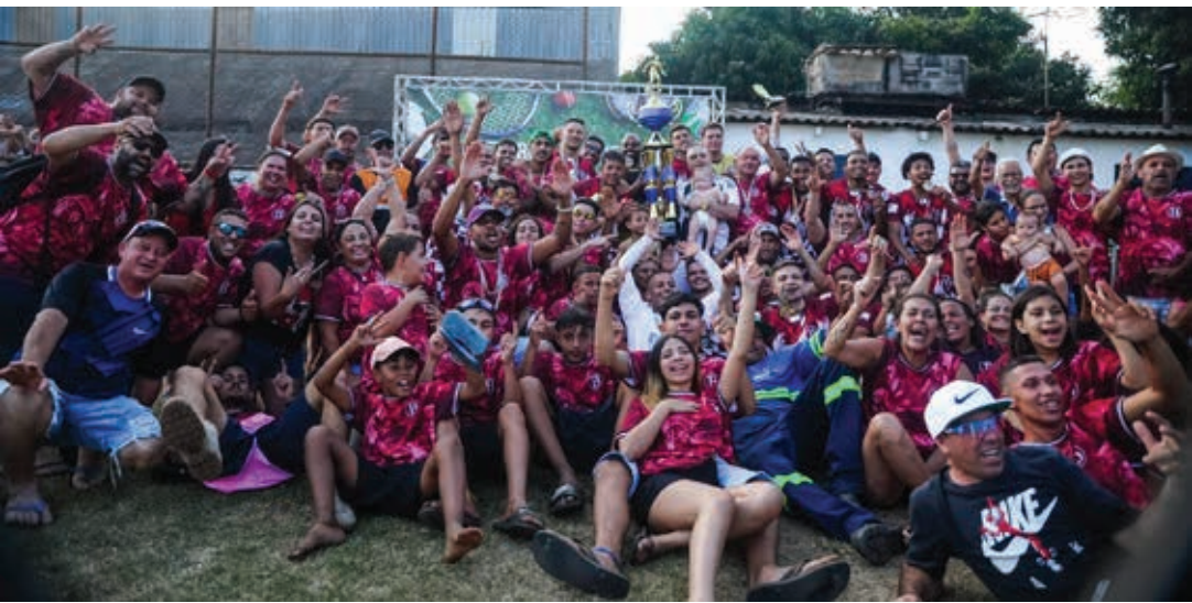
Equipe do Atibaianos, da zona rural de Bragança, ficou com o vice-campeonato

Na temporada de 2024, o campeonato, organizado pela Liga Bragantina de Fu-