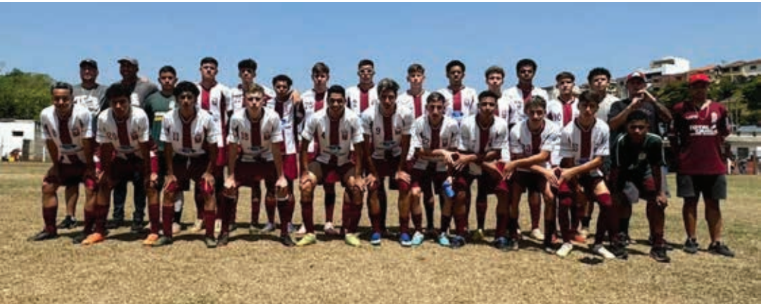
Ferroviários conquistou o título de campeão nas categorias Sub-15 e Sub-17

No último domingo, 29, chegou ao fim o Campeonato Municipal de Futebol de Menores de Bragança Paulista 2024. A competição, que contou com a participação de dez equipes nas categorias Sub-15 e Sub-17, reuniu aproximadamente 450 jovens atletas. As finais foram disputadas em rodada dupla no Estádio