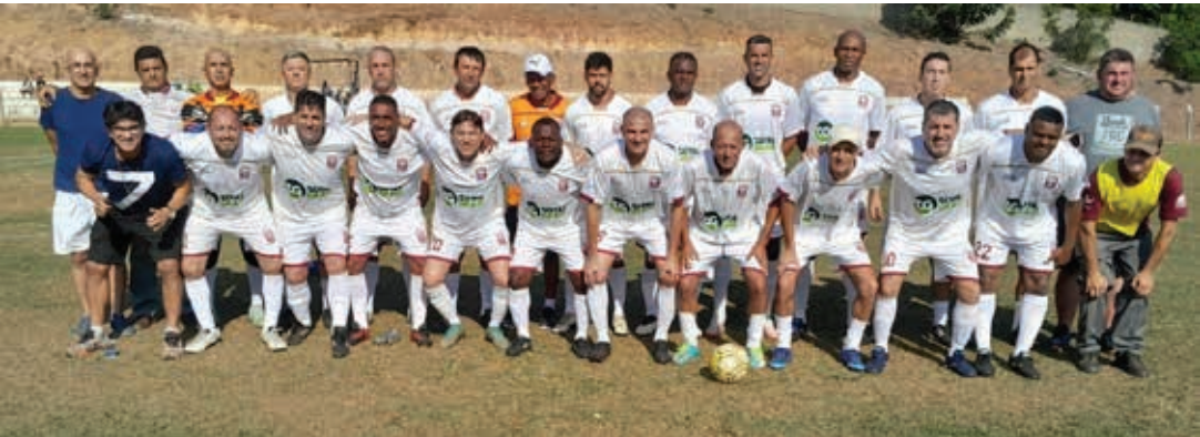
Equipe do Ferroviários ficou com o troféu de vice-campeã