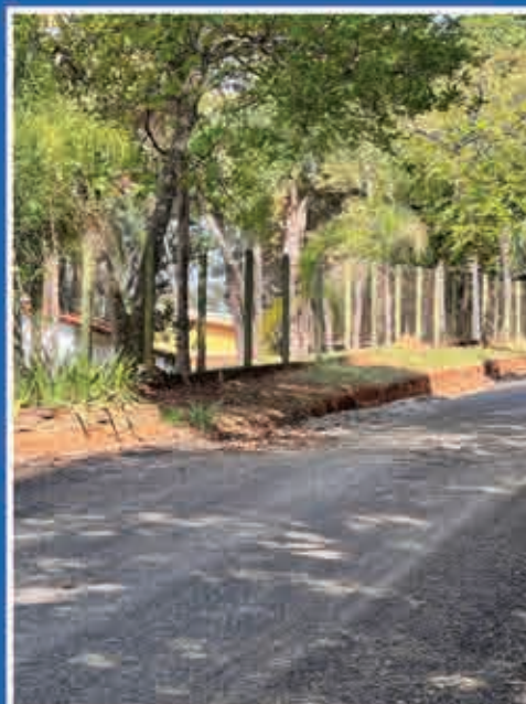
Estrada Municipal Hilário Alves dos Santos - Água Comprida