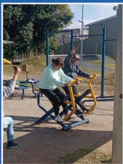
Academia ao ar livre Águas Claras

84 academias ao ar livre instaladas, sendo 10 para pessoas com deficiência (PCDs)