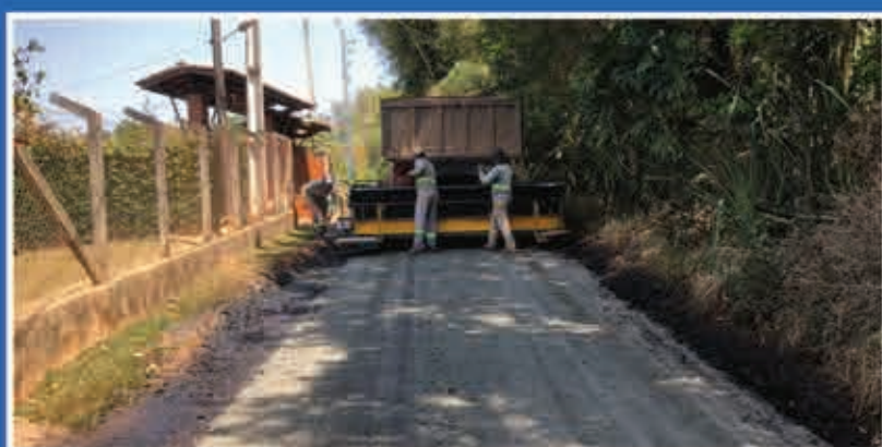
Estrada Municipal Ramiro Francisco de Azevedo Filho bairro Atibaianos