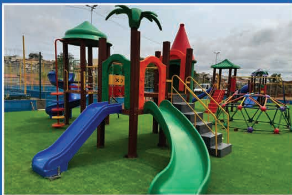
Terra da Magia Vila Davi

Implantação de +4 Terros do Magio (Hípico Jaguari, Vilo Aporecido, Parque dos Estados e Vilo Davi)