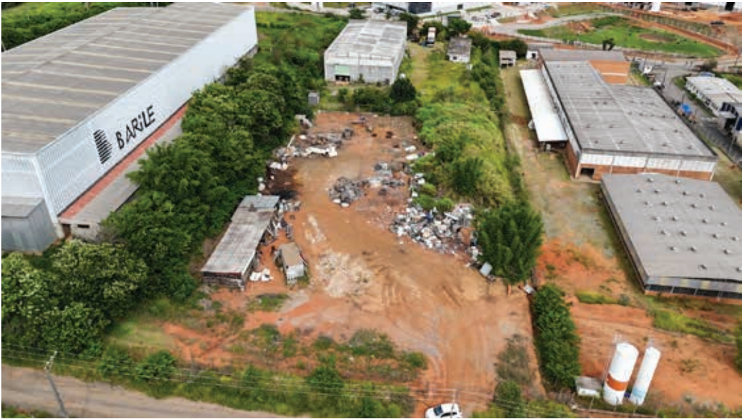
Terreno Tropical Estufas