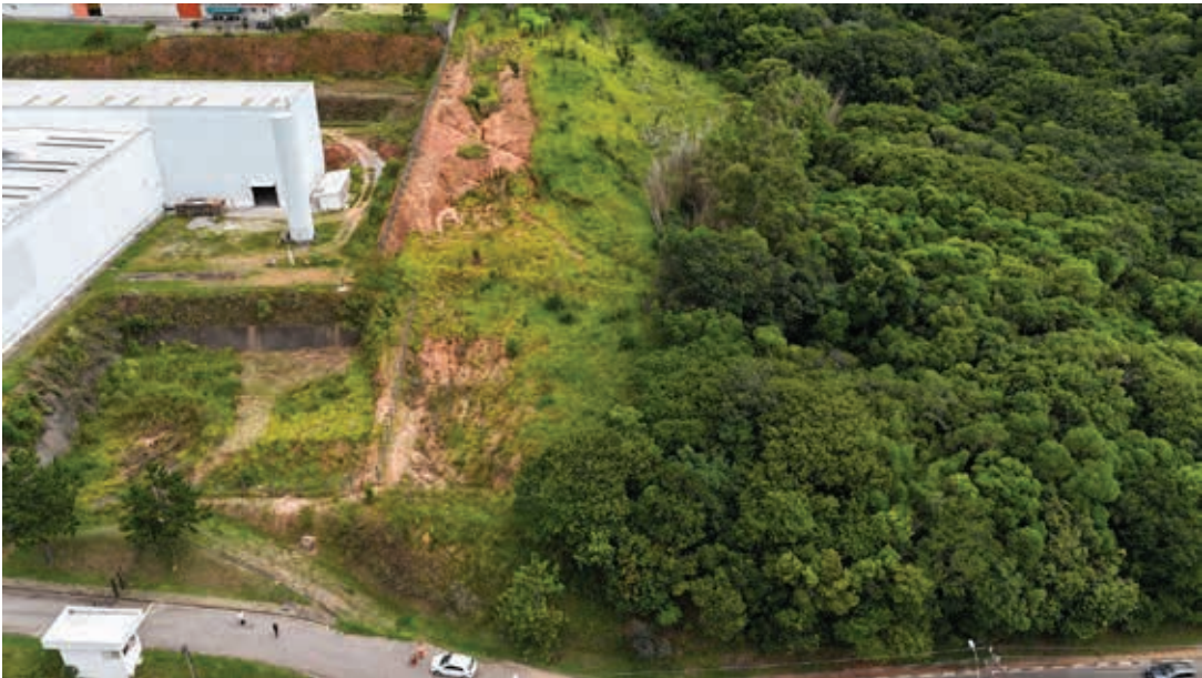
Terreno Volk Confeções