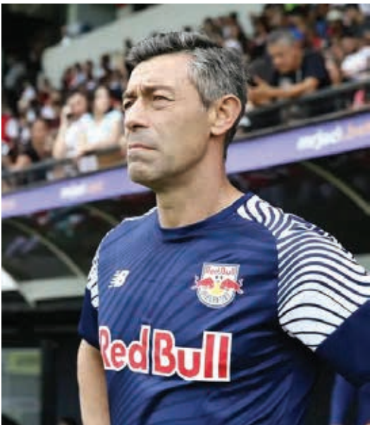
Treinador português, Pedro Caixinha, reencontra seu ex-clubes em um jogo decisivo que vale vaga na semifinal do Paulistão 2025