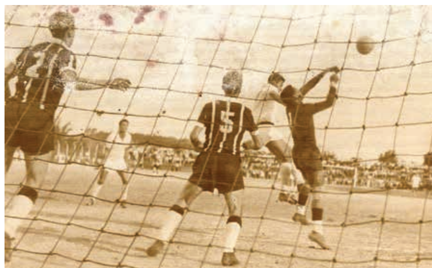
Pelé, o maior jogador de futebol de todos os tempos, desfilou seu talento nos gramados do Marcelão em duas oportunidades: em 1958 e 1966, marcando quatro gols nas duas partidas