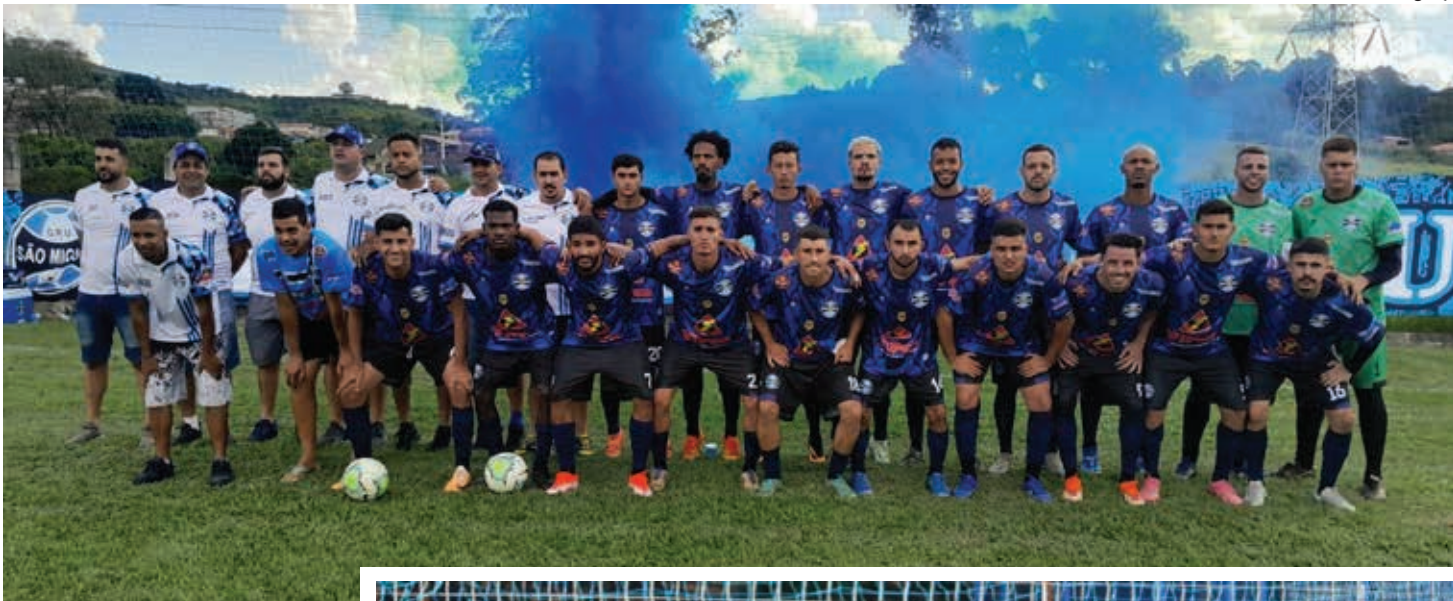
Time do Grêmio São Miguel venceu a Vargense por 6 a 0, na maior goleada da rodada de abertura do Amadorzão 2025

Lourenço fará sua estreia no campeonato duelando em casa, no Estádio Mário Guilherme dos Santos, contra o Grêmio São Miguel. A Vargense recebe o Lavapés na cidade de Vargem, e, no Campo do Formigão, o Cedege enfrentará o Campinho.