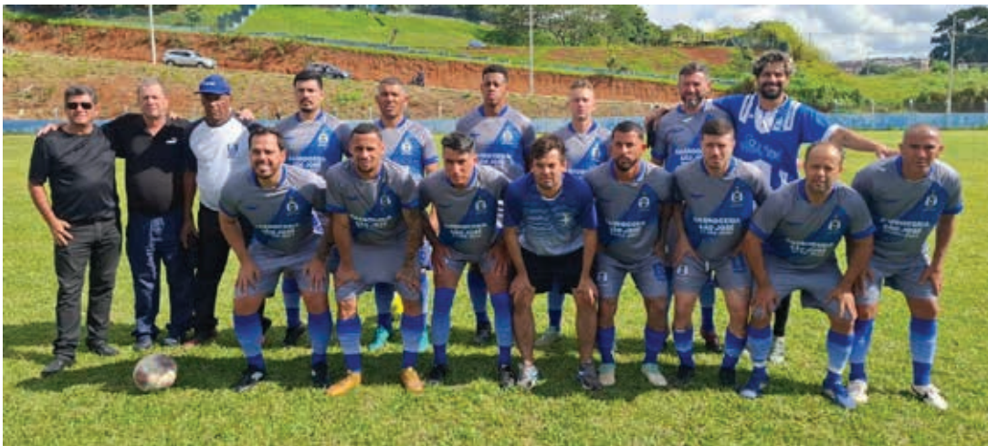
Times do Unidos e do Bandeirantes de Vargem estreados com vitórias no Campeonato Amador da Série B de 2025

O Campeonato Amador da Segunda Divisão de Bragança Paulista terá sequência, na tarde deste domingo, 4, com a realização da segunda rodada. A Liga Bragantina de Futebol programou seis partidas, que serão disputadas em rodada dupla nos campos do Vila Garcia, Parque dos Estados e Bandeirantes, em